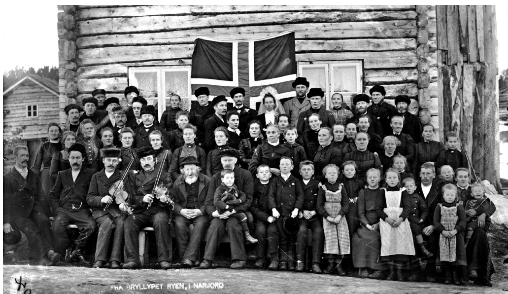
Bryllup på Ryen, Narjord. (MINØ.4686)