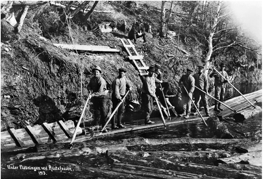
Under Flåtningen ved Røstefossen. 1913.