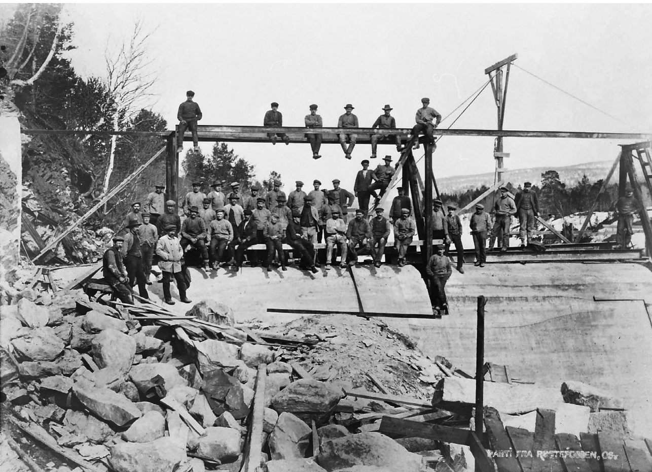
Arbeidere ved Røstefossen, Os. 1913. (MINØ.46251)