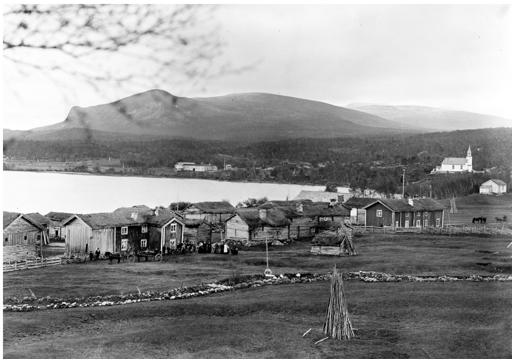
Oversikt over Narbuvoll. (MINØ.4871)