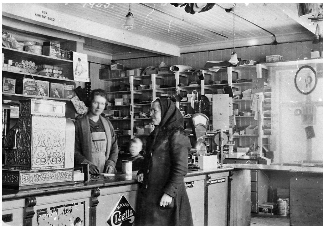
Interiør fra Os samvirkelag. 1923. (MINØ.2390)