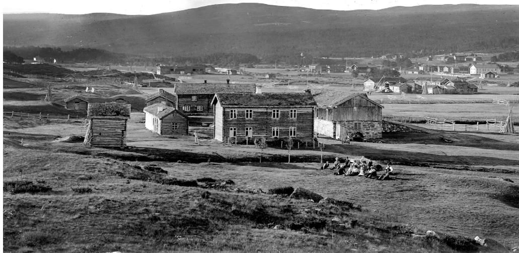
«Parti fra Narjord». (MINØ.4843)