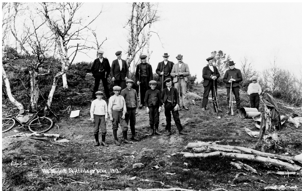
“Ved Narjords Skytterlags Bane. 1913”. (MINØ.46280)