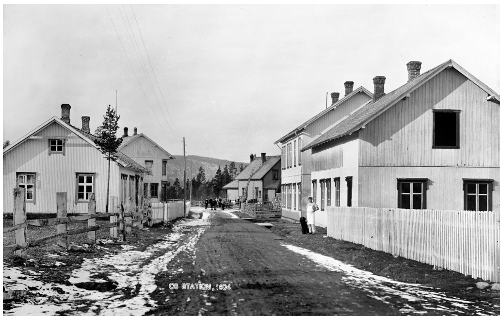
Os stasjon. 1904. (MINØ.4770)