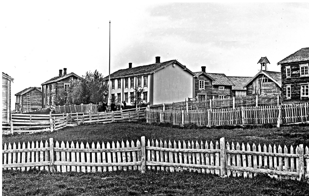
Os-gardene, før tyskerne brente de ned under krigen. (MINØ.4666)