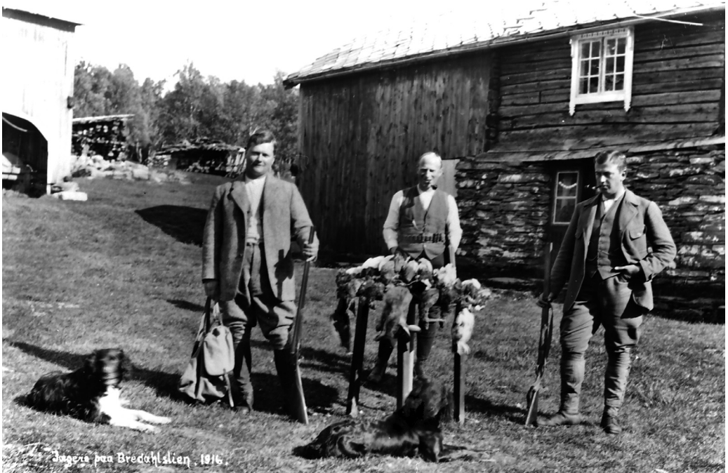
Jægere paa Bredalslien. 1916.