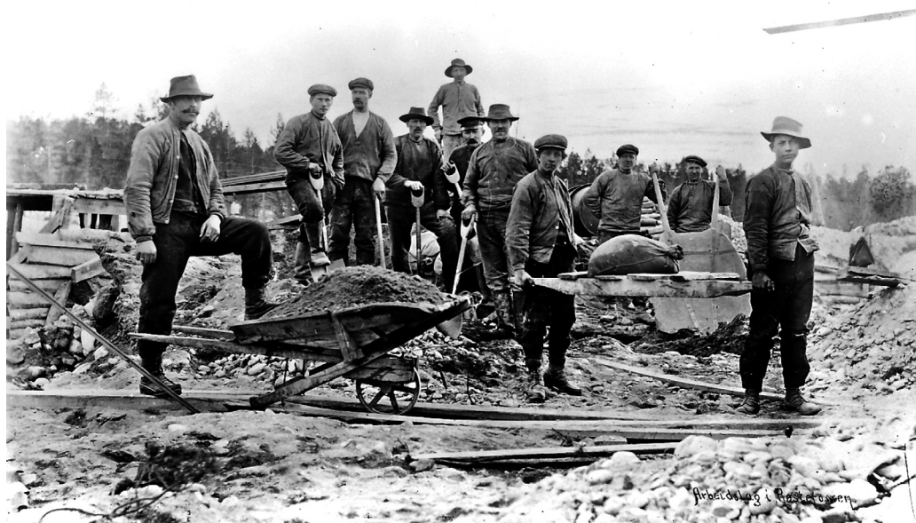
“Arbeidslag i Røstefossen”. (MINØ.46264)