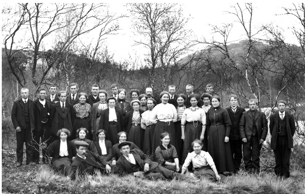
Ungdommer fra Tufsingdalen. 1914. (MINØ.4777)