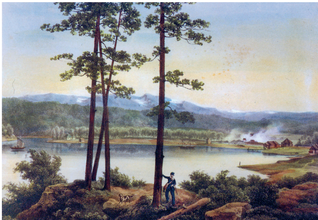
Verksodden i Espedalen med nikkelverket, trolig malt av bestyrer David Forbes.

som hadde familie, fant seg med tiden tømmer i skogen og satte opp egne små stuer.