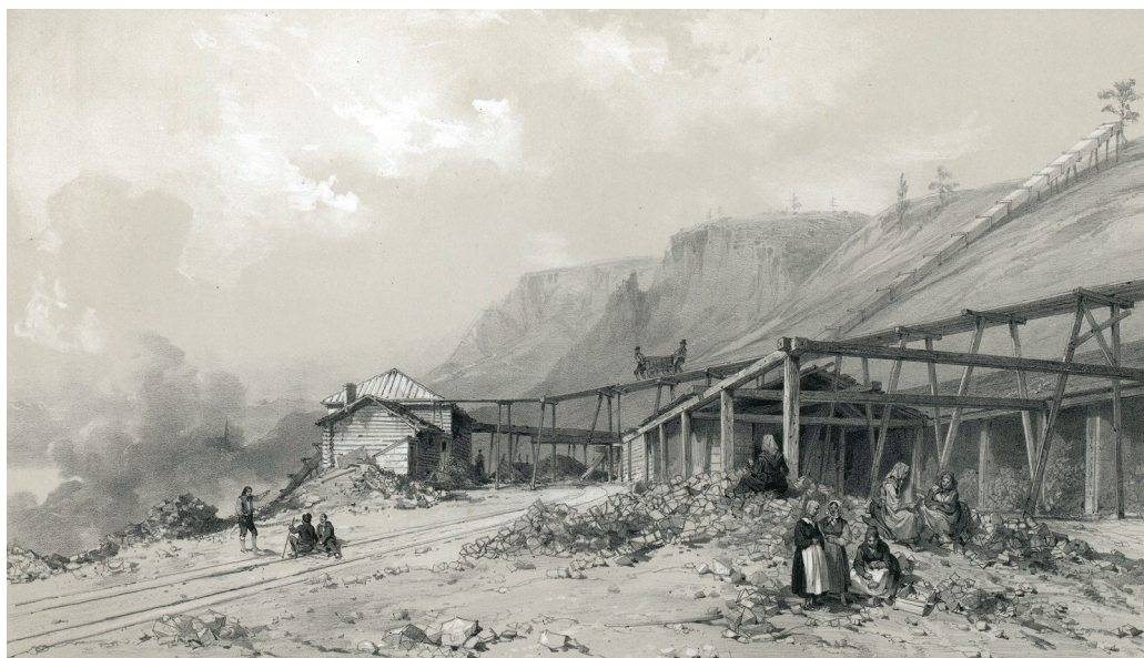
Kåfjord kobberverk. Illustrasjon hentet fra boken "Voyages de la Commission scientifique du Nord, en Scandinavie, en Laponie, au Spitzberg et aux Feröe" av ukjent forfatter og utgitt av Arthus Bertrand (Paris, 1852).

krutt, så det forekom mange ulykker, også noen store som medførte dødsfall. Etter hvert ble det dannet et nettverk av ganger og sjakter inne i gravene. Selv om gruvearbeiderne fikk bruke beste sort talglys, var det svært dårlig belysning i gravene, hvilket var et stort problem, spesielt når de skulle sprengje. Alle måtte gå med en kofte av hvitt tøy for at de skulle kunne sees av de andre som arbeidet der. Kulden skal ha vært svært plagsom. Gruvegangene skal ha vært lave og fuktige slik at arbeiderne ofte måtte vasse i vann til anklene, og det dryppet stadig fra taket. Det verste skal imidlertid ha vært den kvelende svoveldampen som var overalt.