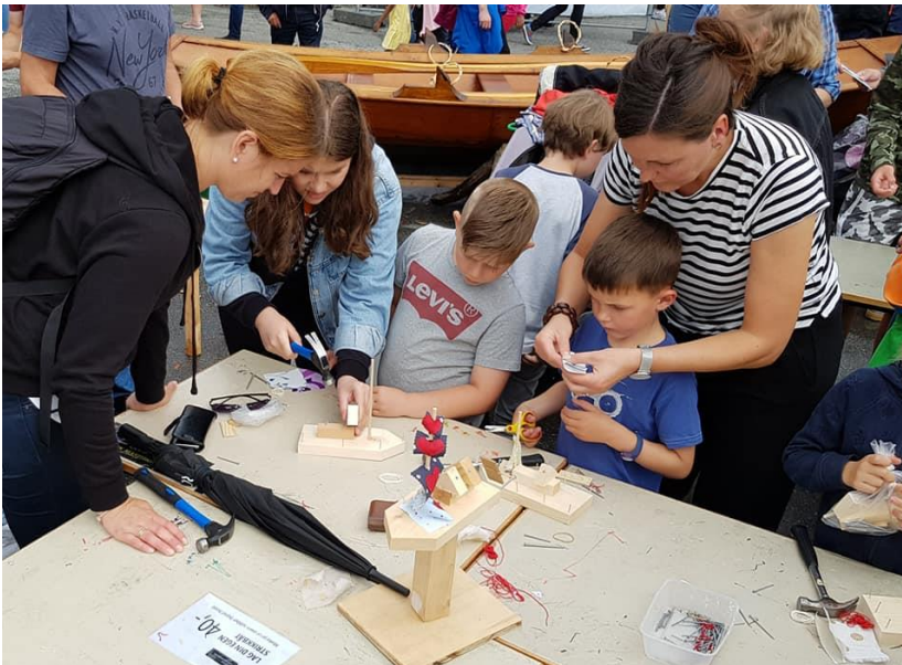
Bergens Sjøfartsmuseums aktivitet, Tall Ship Races i Bergen, 2019

Planen omfatter publikumsrettet arbeid i Museum Vest. Markedsføring, salgs- og annet informasjonsarbeid omfattes ikke av denne planen, og kommer i en egen plan.