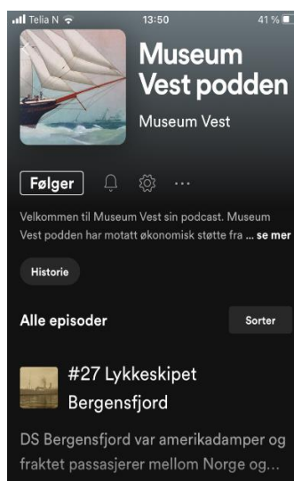
Museum Vest podden