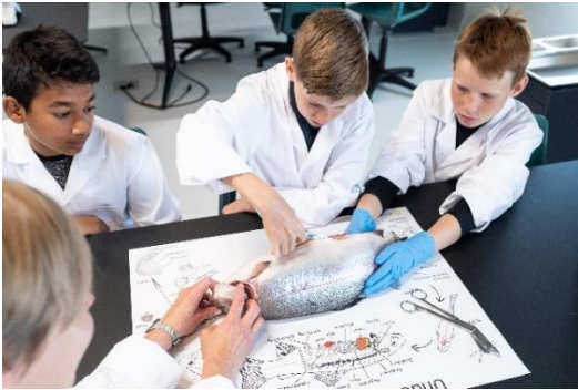
Undervisning ved Storeblå, Norges Fiskerimuseum