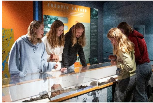
Elever i båthuset, Bjørn West Museet