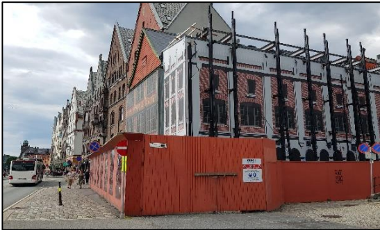
Restaureringen av Det Hanseatiske Museum, 2021