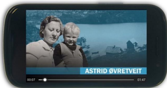
Mobilappen «Telavåg1942», Nordsjøfartsmuseet