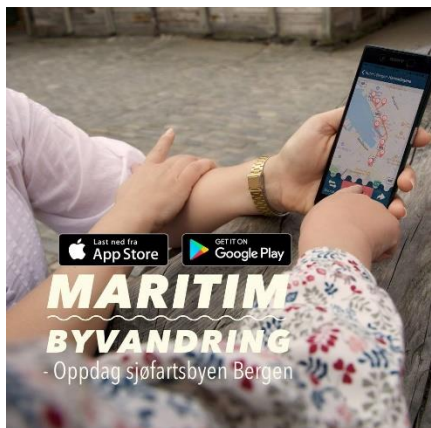
Mobilappen Maritim byvandring, Bergens Sjøfartsmuseum