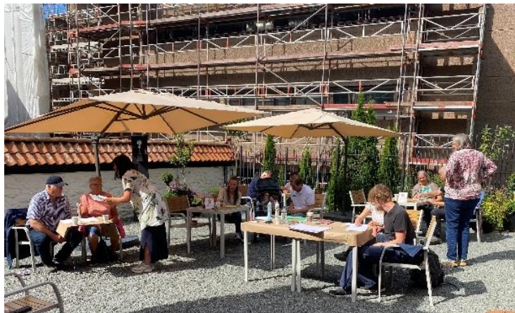
Sommerkafé 2021 ved Schøtstuene, Det Hanseatiske Museum