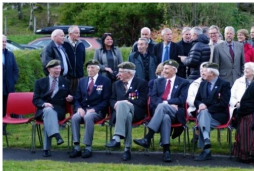
Avduking av Fredrik Kayser-byste, Matre, Bjørn West Museet.