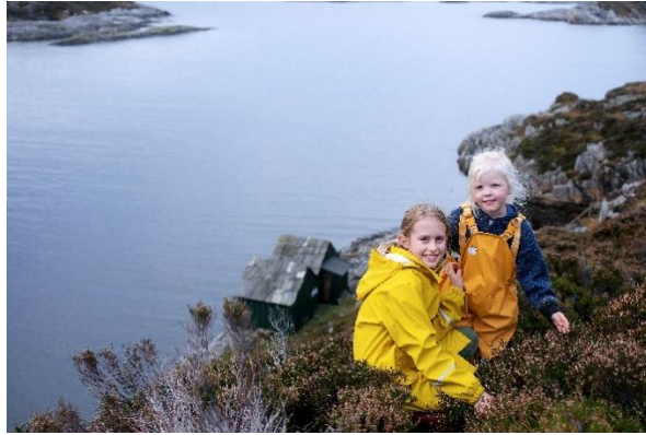
Tur til Selstøbuene i Telavåg, Nordsjøfartmuseet