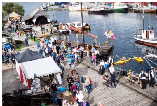
Sandviksdagene, Norges Fiskerimuseum og Kystkultursenteret