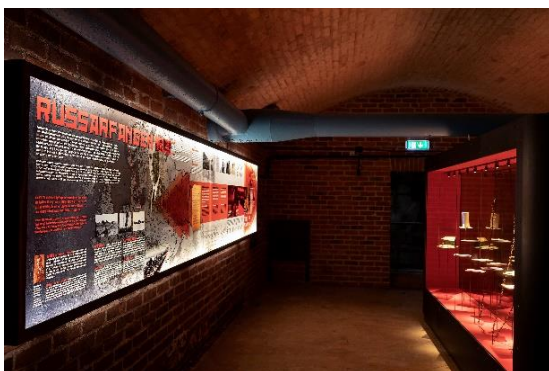
Utstillingen Russefangane, Fjell festning