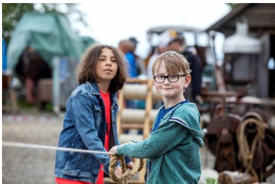
Repslagning, Norges Fiskerimuseum