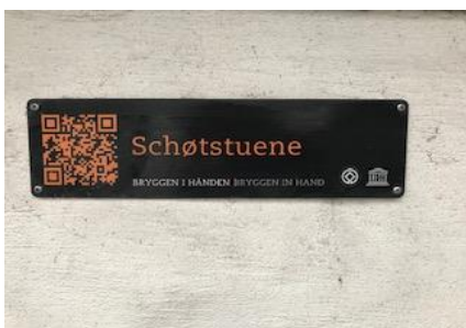
Med Bryggen i hånden, Det Hanseatiske Museum