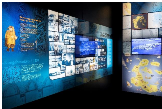
Lokalhistorisk utstilling, 2021, Herdla museum