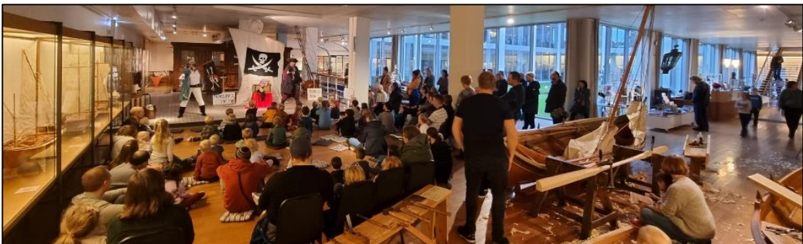
Maritime familiedager 2021, Bergens Sjøfartsmuseum