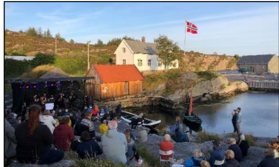
Los-jubileet 2021, Kystmuseet i Øygarden