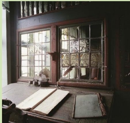
Kjøpmannsstuen, Det «gamle» Hanseatiske Museum

Utstillingsarbeidet vil fokusere på trehovedtema: Økonomiske utviklingslinjer og globalisering, mangfold og kulturmøter, Finnegården. Det er et mål at Det Hanseatiske Museum skal oppfylle rollen som et internasjonalt museum og et lokalt forankret museum. I tillegg skal bærekraft, inkludering og mangfold kjennetegne virksomhet og tilnærming. Det å ta hele verdensarvstedet Bryggen i bruk i formidlingsaktiviteter, er også viktig.