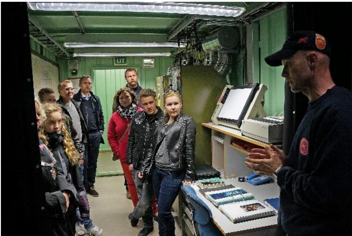
Torpedobatteriet, Herdla museum