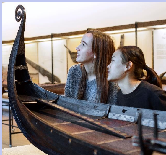
Avdelingen for «vår eldste sjøfart» er i stor grad uforandret siden 1962, men modellen av Osebergskipet vekker fortsatt stor interesse hos publikum.

Fornyingen av utstillinger og publikumsområder vil ikke bare være et stort løft for Bergens Sjøfartsmuseum, men også for Museum Vest og kulturbyen Bergen. Fornyingsarbeidet vil strekke seg over hele planperioden. I 2022 vil masterplanen bli presentert og det vil bli lagt en plan for arbeidet med finansiering og realisering av hovedprosjektet.