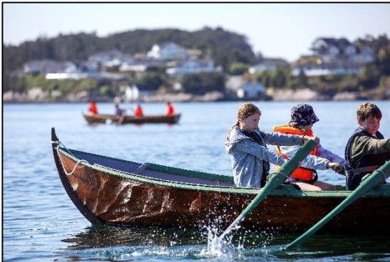
Aktiviteter, Herdla Museum