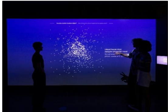
Storeblå visningscenter for havbruk, Norges Fiskerimuseum