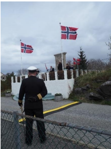
8. mai-markering, Telavåg

Det skal legges til rette for at formidlerne i MV holder seg orientert om formidlingsfeltet generelt og det digitale formidlingsfeltet spesielt. Kompetanseheving gjennom f.eks. kurs og seminar skal prioriteres.