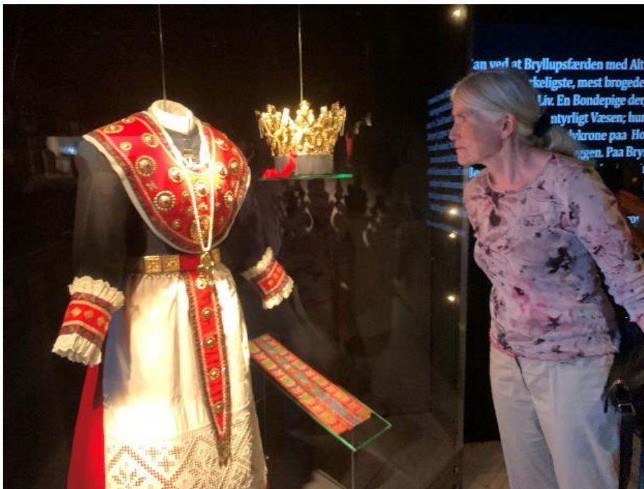
Drakt- og tekstilutstilling 2021, Kystmuseet i Øygarden