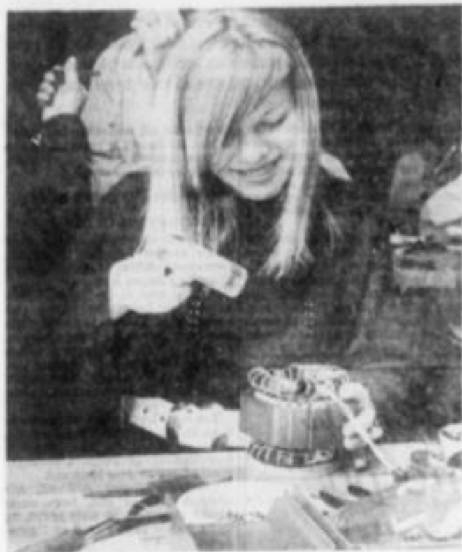
Murevna Proje - Jeg ville ud at se mig om

22 kvinder i alderen mellem 18 og 30 sidder ved et par lange borde og lodder kobbertråde. Der er lyse, og der er mørke piger, nogle med langt hår, andre med kort.