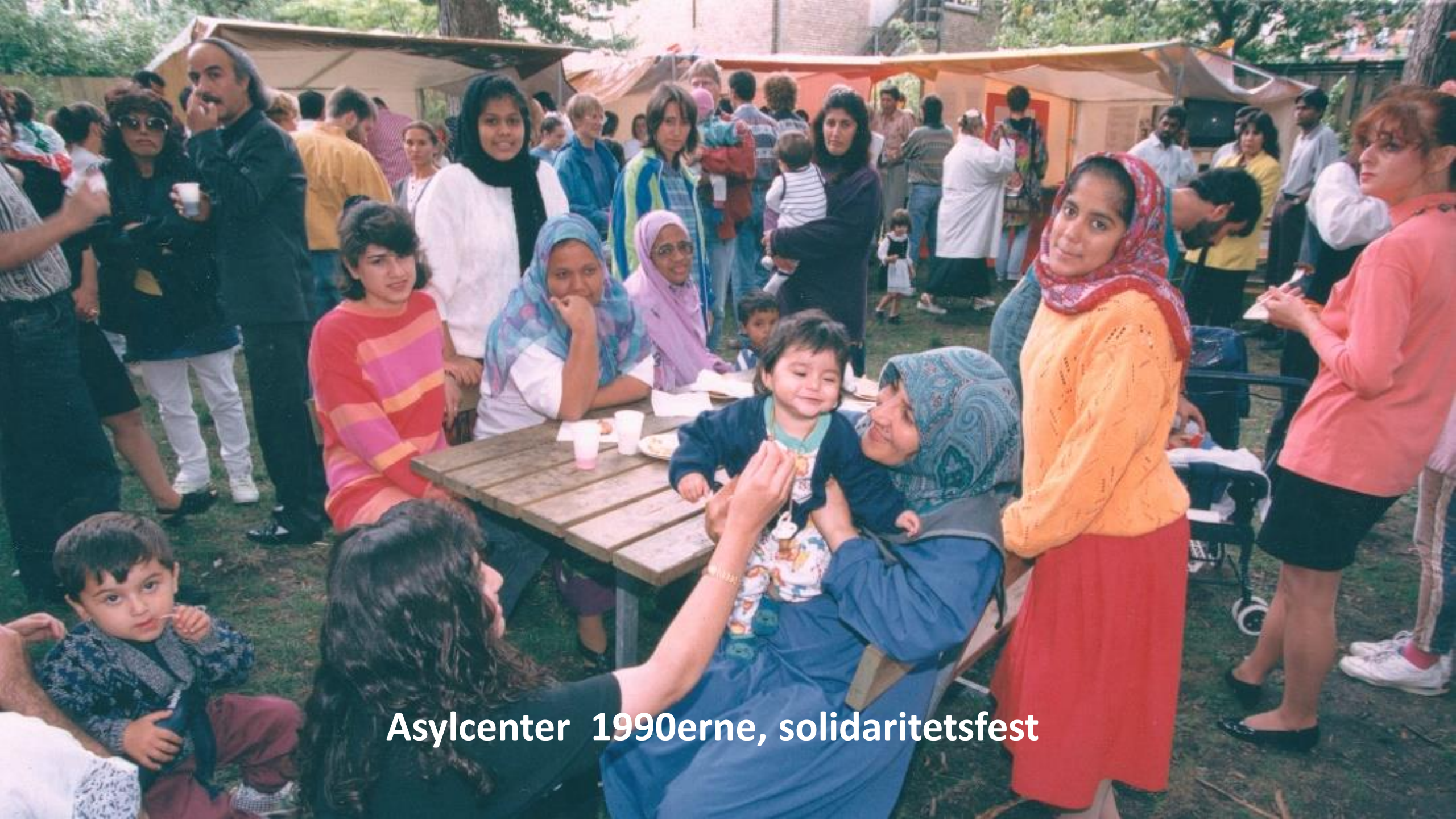
Asylcenter 1990erne, solidaritetsfest