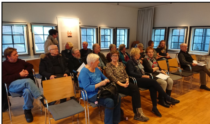
Trofaste museumsvenner.