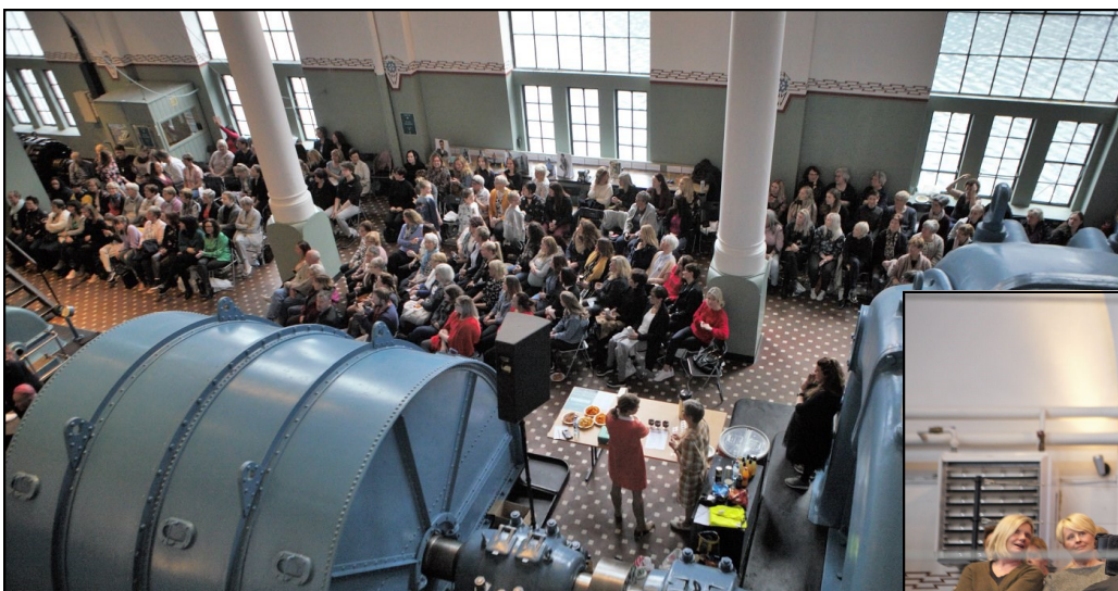
Moteshow og bli-ny-dag.

Det kjem fleire arrangement - her er det berre å fylgja med!