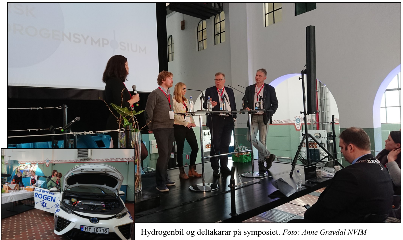
Hydrogenbil og deltakarar på symposiet.

På Hydrogensymposiet kunne ein tydeleg merka optimisme hos moglege produsentar og brukarar etter nokre år med vanskar med introduksjon av hydrogen på Vestlandet.