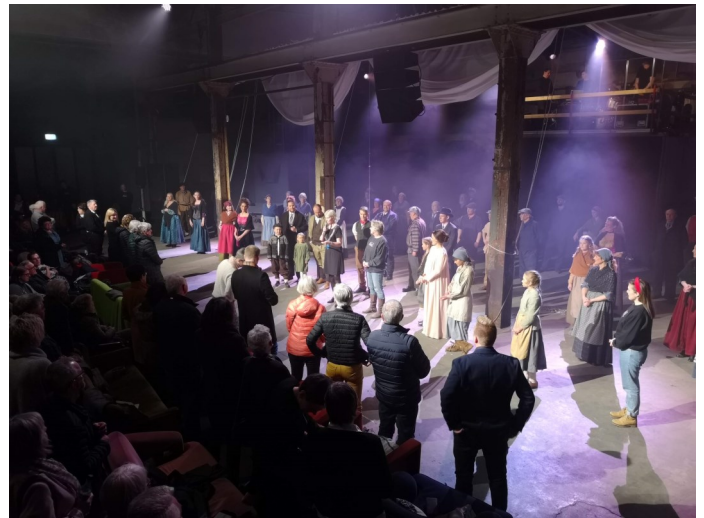
Velfortent jubel og trampeklapp etter premieren 6. april.