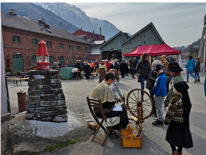
Marknad på Lindeplassen før premieren.