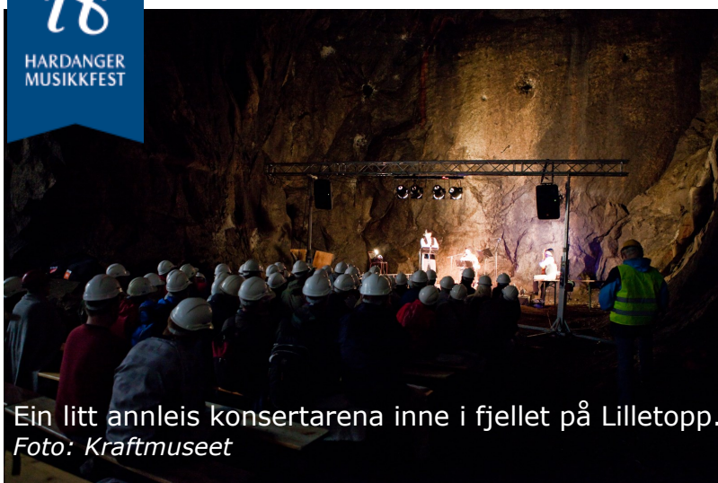
Ein litt annleis konsertarena inne i fjellet på Lilletopp.