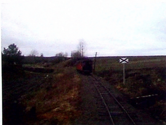
Bremsehjelp. Her trenes det på ekte vis.