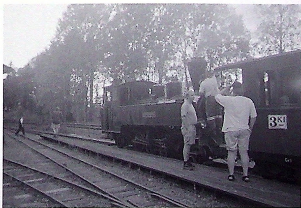
Klart for skumring-stog tilbake til Sørumsand etter en vellykket grillkveld.