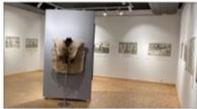
KAPPE: Tore Hundts cephoris på Vårdabåli museum. Samene skal ha laget kappen som Tore Hund brukte under slaget på Stiklestad.