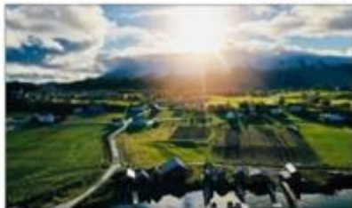
MIDTI I BILDET: Mellom naust nr 4 og nr 5 fra venstre - ser man sporene etter Tore Hundts naust.

mer om samisk vikinghistorie fra Vårdabåli museum. Harstad Tidendes serie «På hjul i Sigrids fotspor» skal også bli en del av pensum for ungdomsskolen.