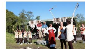
TROND OG TYRA: Forestillingen Trond og Tyra på Trondenes gjennomføres som et av arrangementene under 1000-årsjubileet.

tene som ble presenterte nevnes blant annet: Kultursti på Bjarkøy skal tilrettelægges Anna Rogde på tokt i Tore Hunds kjølvann Pilegrim i Nord: Mulig pilegrimsrute fra Trondenes til Trondheim. Oslokdagene: Eigne arrangementer Rondens vikingmarked Ungdommens herpeli Vest-Harstad vil etablere dynamiske hjemmesider som presenterer de ulike arrangementene med muligheter for å bestille billetter der det selges til disse. ANDREAS ISACHSEN as@rt.no