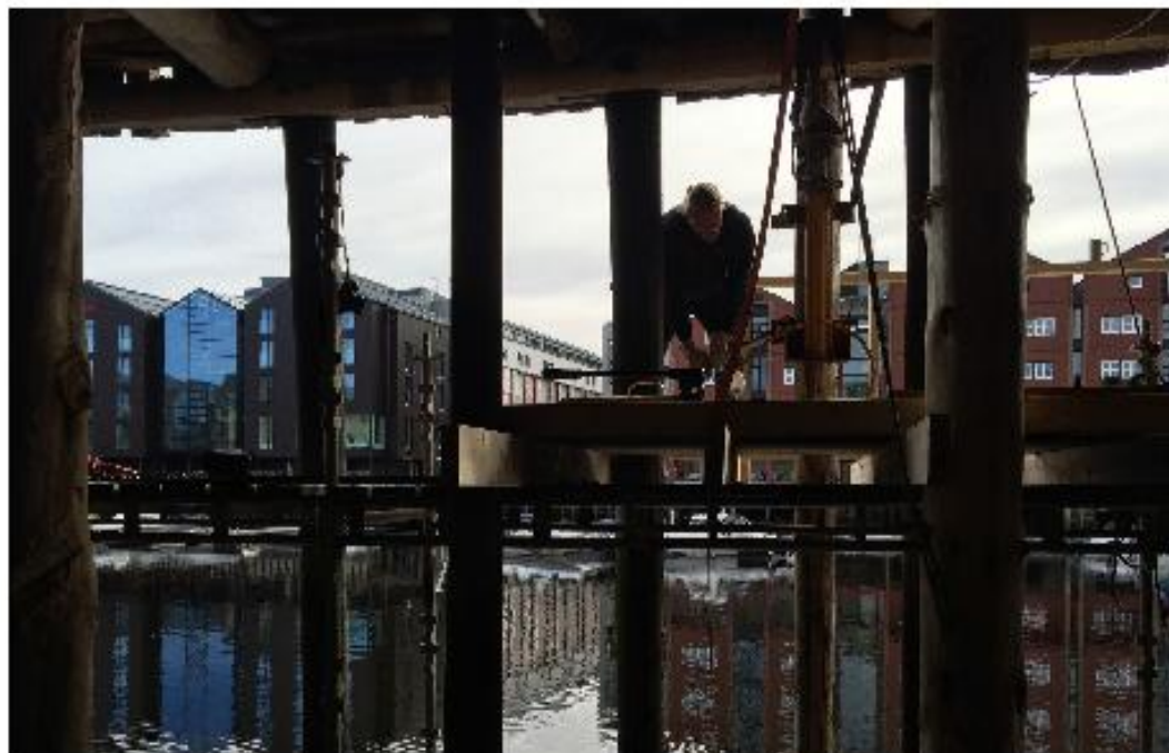
Vitaliserings- prosjektet

Arbeidene med stolping og peling av Kjøpmannsgata 53-55 ble ferdigstilt i oktober 2015. Arbeidet har fulgt både kostnads- og fremdriftsplan. Alle stolper under nr 55 og 8 stolper under nr 53 er skiftet ut. Mange var borte eller ødelagt, og noen ble for korte etter jekking. 2 bunnstokker under 55 og 1 bunnstokk og 2 enkeltfundament under nr 53 er skiftet ut. Deler av flåte er fundamentert med nye materialer. 5 pæler som manglet i front i den ytterste stolperekka mot elv, er supplert.