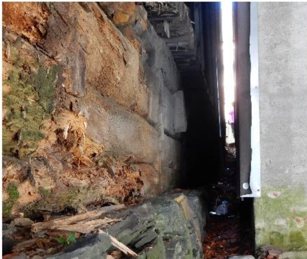
Vitaliserings- prosjektet

Arbeidene med refundamentering av Kjøpmannsgata 29 er i full gang. Her er stolper og pæler lite skadet men nedre del av tømmerkonstruksjon har råtesaker. Det er krevende å skifte ut tømmer når avtanden til nabobrygge er mellom 0,5 og 1 meter.