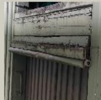
Detalj mellom porter

Istandsetting av fasade mot Kjøpmannsgata. Kledning, porter og vinduer beholdes, men repareres. Maling skrapes ned og ny linoljemaling påføres. Fargevalg med basis i fargeundersøkelser av eksisterende kledning. Kledning på ny vegg i første etasje tilpasses. Byantikvaren og fylkesantikvaren følger opp arbeidene gjennom deltakelse i oppstartmøte med entreprenørutvalgte byggemøter. Det er gitt støtte fra Riksantikvaren gjennom Sør-Trøndelag fylkeskommune.