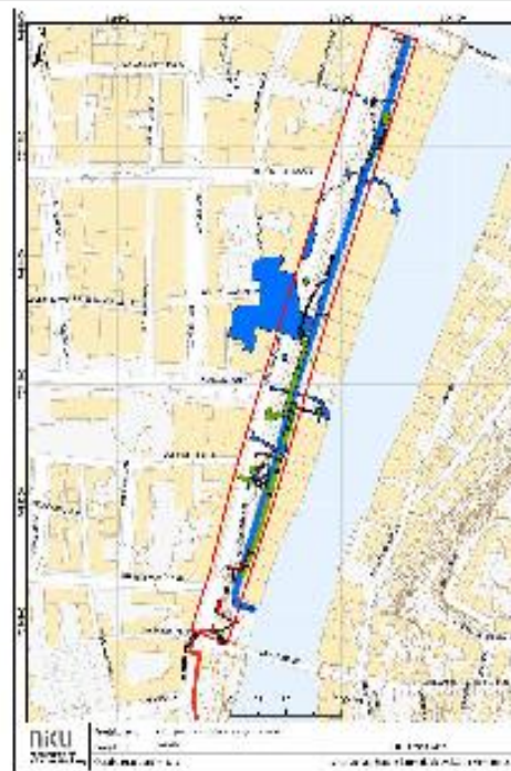
Figur 7. Oversiktskart øvre del av kartleggingsområdet, utførelse og utskiftningsarealer.

Rapporten samler arkeologisk informasjon fra arkeologiske undersøkelser fra perioden 1973 – 2015 i Kjøpmannsgata i Trondheim, i området mellom Gamle Bybro i sør og Bakke Bro i nord, og fra Kjøpmannsgatas øvre gateløp, vollen og det nedre gateløpet. I undersøkelsen er informasjonen delt inn i tre klasser av sårbarhet. Klassene er definert på grunnlag av avstanden mellom eksisterende overflate og topp kulturlag. Det arkeologiske materialet er delt inn i fem typer av kulturminner. I tillegg til kartlegging av arkeologisk informasjon, er utsjaktninger og moderne inngrep i området vist på kart. Gjennomgangen har vist at det finnes store kunnskapshull i den arkeologiske informasjonen.