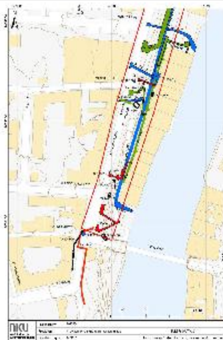
Figur 6. Oversiktskart nedre del av kartleggingsområdet med utførelse og 15 sønner.

Illustrasjoner: Vitaliserings- prosjektet Riksantikvaren/NIKU