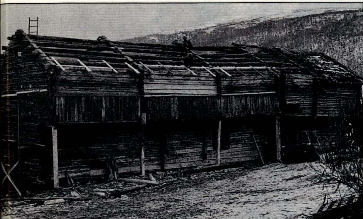
Vern av bygninger. Restaurering av låven i Nyhusa, 1991. (66406).

arbeidet kostnadsanslag for restaurering av deler av denne bebyggelsen.