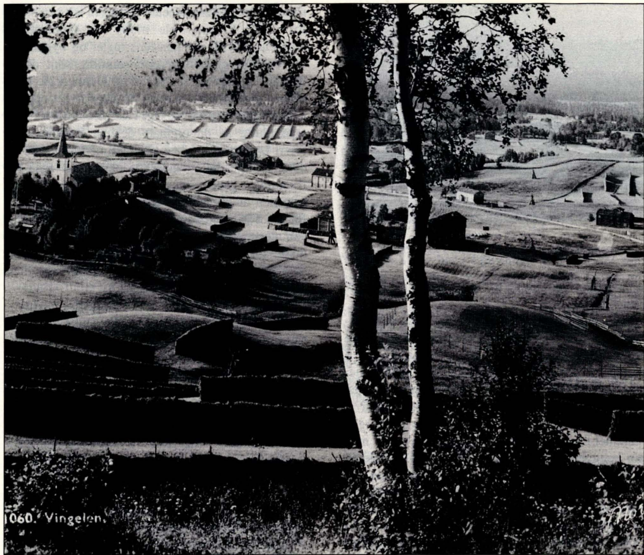
Vingelen i 1950-åra. (Foto: Normann, Hamar).