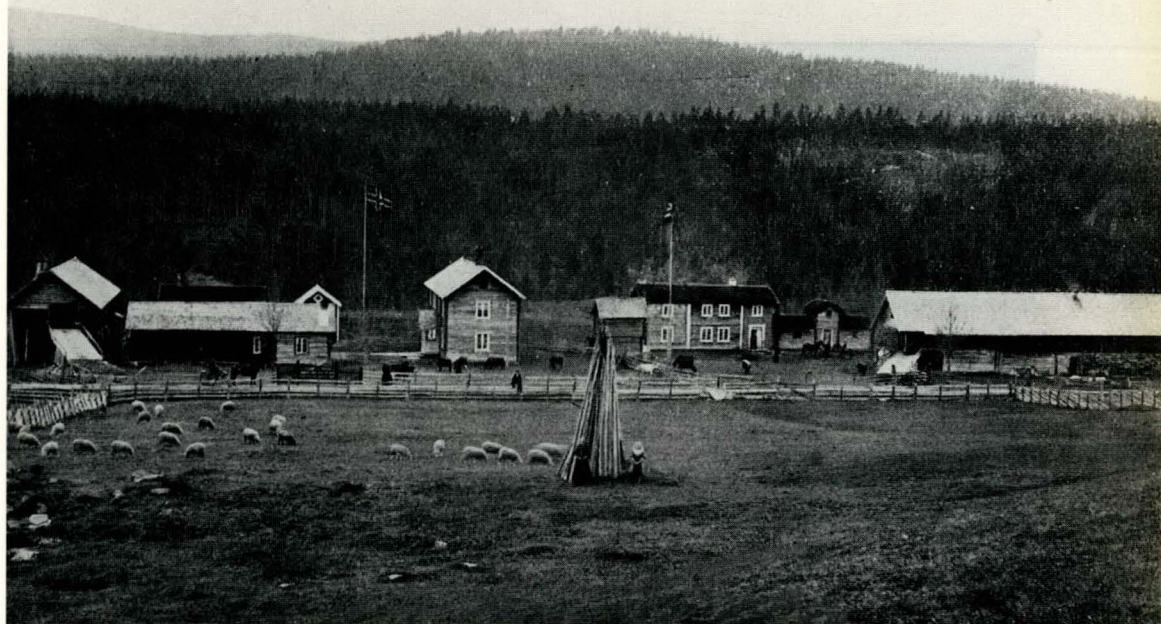
Erlimoen og Storbækken, Tolga.