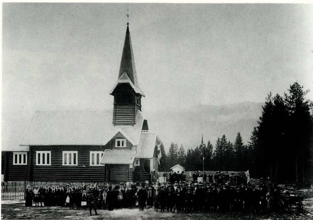
Sjøli kapell, under innvielsen av kapellet i 1914. Repro: Musea i Nord-Østerdalen (23745).

grenda merket utreisningen til Amerika. I denne perioden forlot over 100 personer grenda og dro over havet. Det hendte at hele familier emigrerte slik at husmannsplassene ble liggende tomme og forlatt og etterhvert forfalt. En slik husmannsplass var Finnsbekkbua, hvor først åtte av familien dro. Av den neste husmannsfamilien der dro senere seks til Amerika