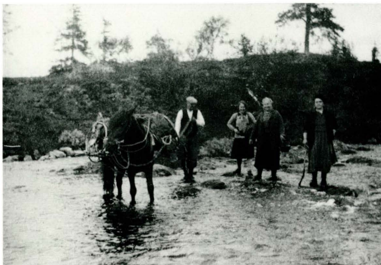
Kløving til Holtsjøen i Singsås. Holta krysses nedenfor Holtsjøen. Bildet er hentet fra boka Glimt i ord og bilder, fra vår nære fortid II. 1994.

kel i Austlandsmål 1974 har eg prøvd å tolke namnet etter gammalnorsk hogld - reipkroken - elva som renn i mange kroker og svingar. Det er ei detaljforklaring av det som Sophus Bugge foreslår for Holta i Haltdalen i Norske Elvenavne, side 105. Det finst inga eldre skriftform enn «Hultdalen» frå 1686 i ei skyldsetting.