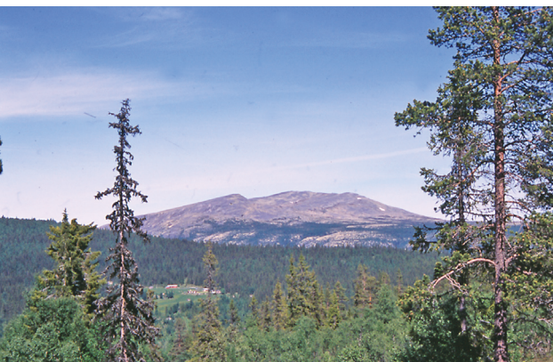
... krysser Aumdalen ved Søgardsvangan ...