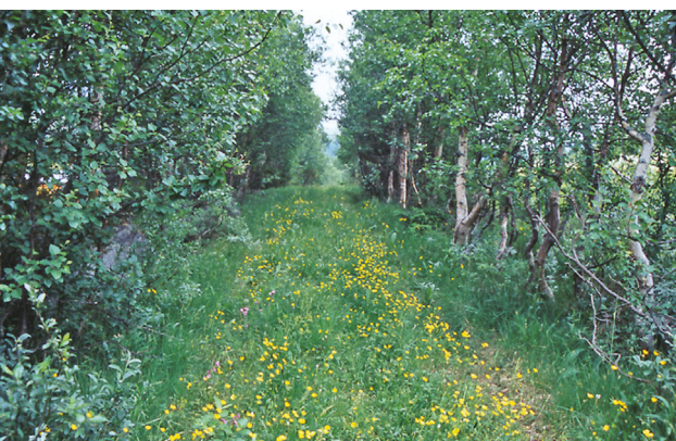
Fra Ellefs plass og opp til Øversjødalen, hvor vegen går mellom gardene.