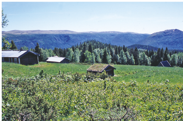
... over Nyseteråsen ...