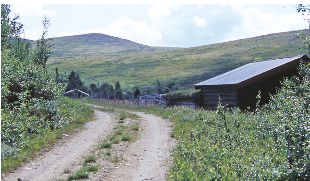
Bete-berget er bratt og tungt, men vel oppe er det åpent og fritt.