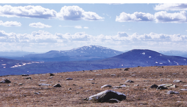
Tilbakeblikk: Spekhøa og Tron. Mellom Brurhøgdas mange topper passeres Vehundfløyet i sørkant.