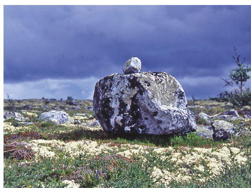
Videre østover – og tilbakeblikk på vegleia ned i og opp att fra Spekedalen.