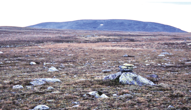
Vegen krysser Storbekkfatet i sørkant – rett mot Gråhøgda.