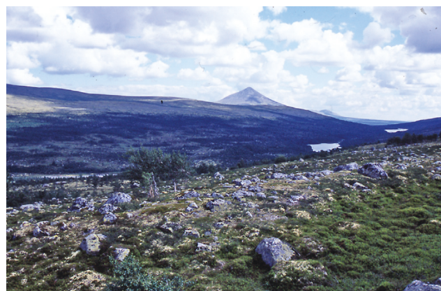
Fiskevegen går over Marabekkriset ned mot Spekedalen.