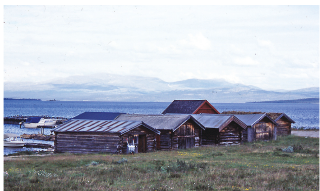
... og ned til fiskevollen ved Buvika. Tylldølene brukte båt opp til Kora-elva.