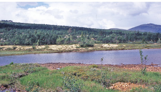
Vadet i nordre Spekesjøen var så grunt at det måtte graves opp for å kunne passeres med motorbåt (1970-åra).