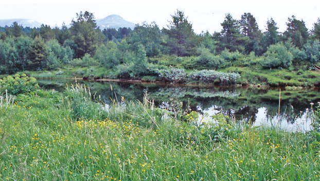
Fiskevegen krysser Hola omtrent ved dagens bru.