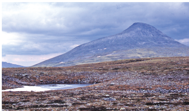
Jeg har "følge av" Elgpiggen hele tida.