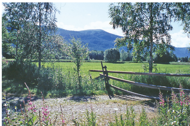
Ned til Berget i Brydalen, hvor Speka krysses lengre vest nå enn før "Stor-Ofsen" – storflommen i 1789.