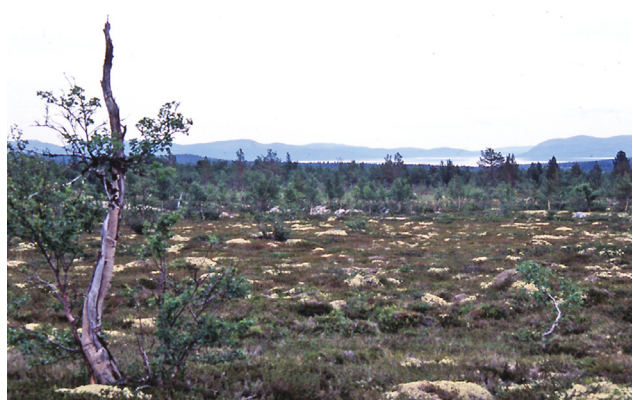
Sørøstover i nedkant av myrfløene, før Andersvollen, skimtes Femund; Gjertrudvollen og Litlåvollen passeres.