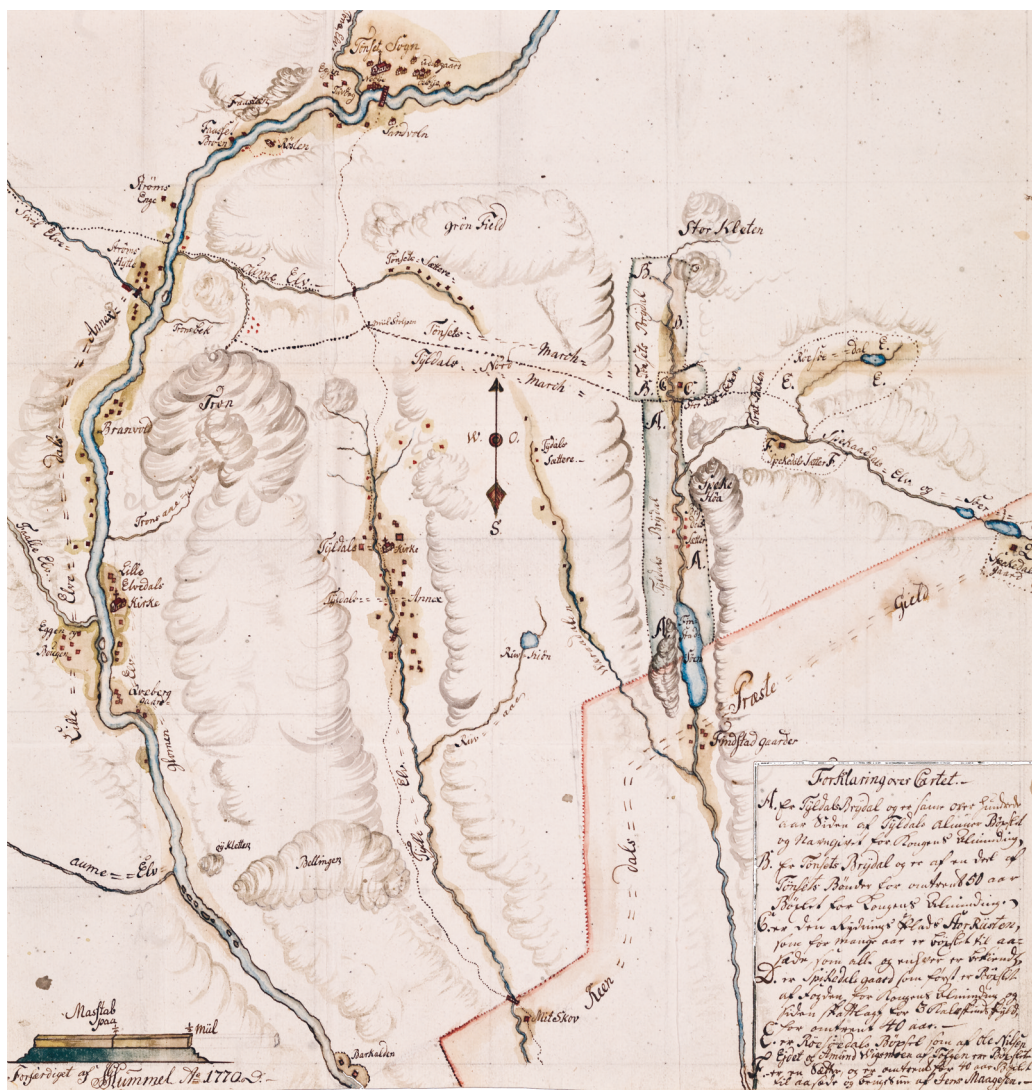
Skoginspektør Hummels kart fra 1770.

møter Brya, "Heele Tyldalens fælles Brydals Sæter".