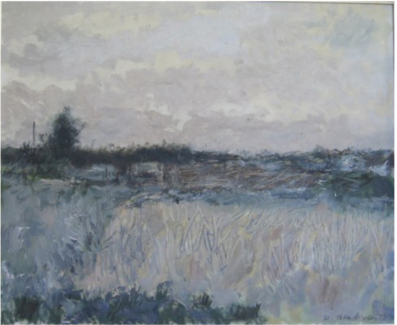
Landskap 1972 – 1977 (82x67)