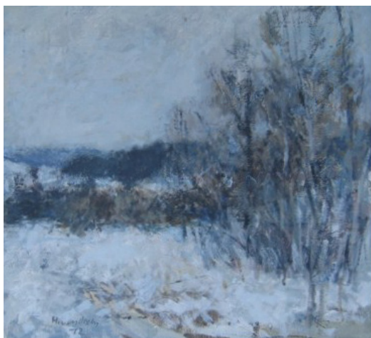
Fra Heggedal 1972 (50x46)