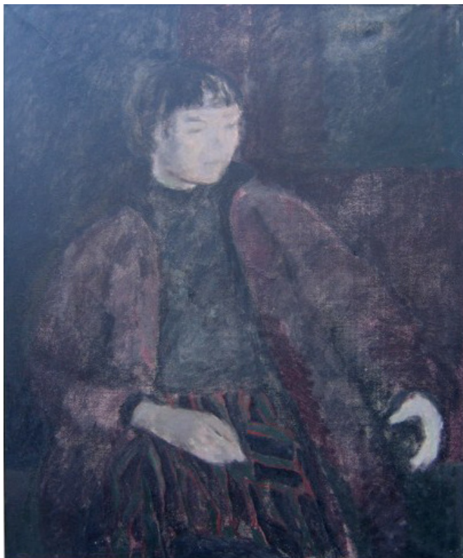
Signe i Vænget 1965 – 66 (81x100)