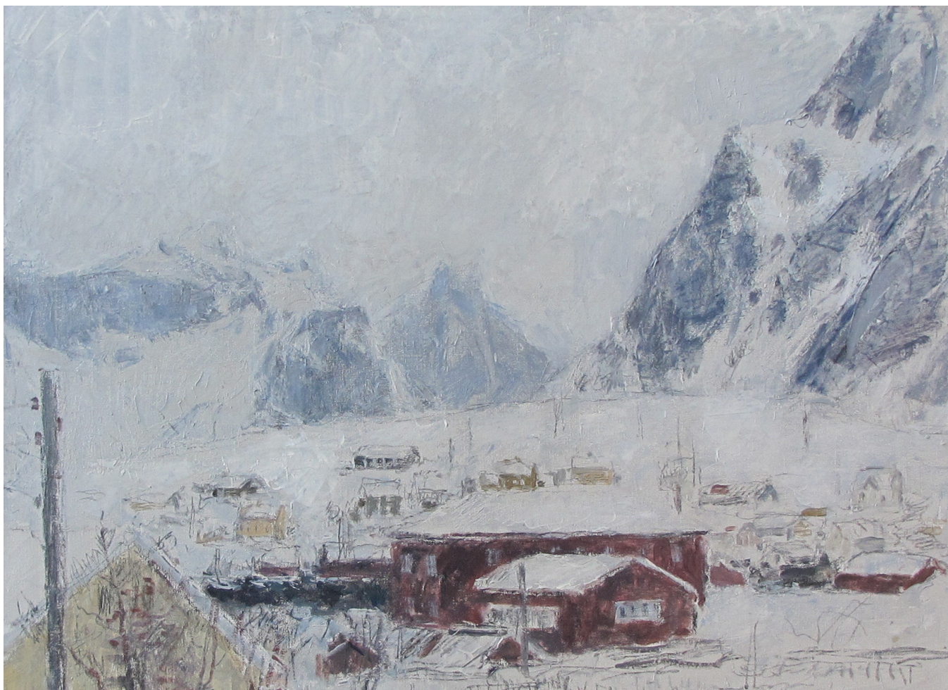
Reine 1976 (80x65)