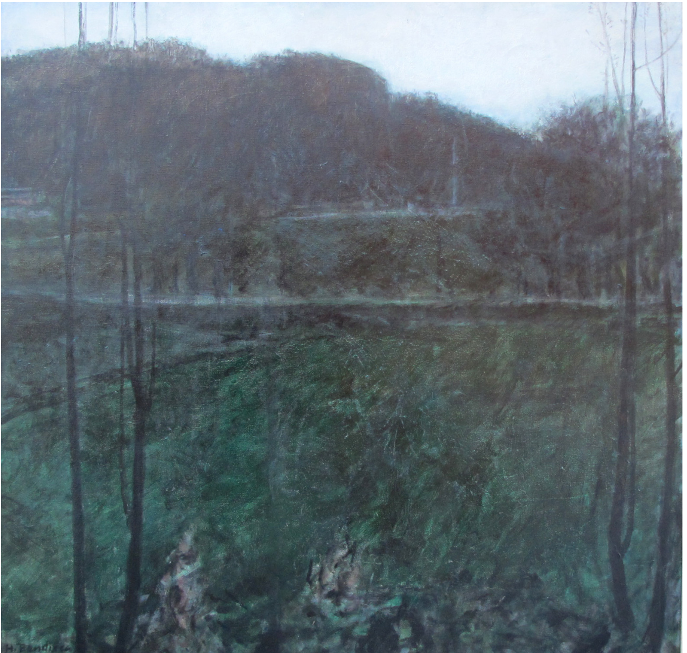
Skaugumsåsen 1974 (118x118)