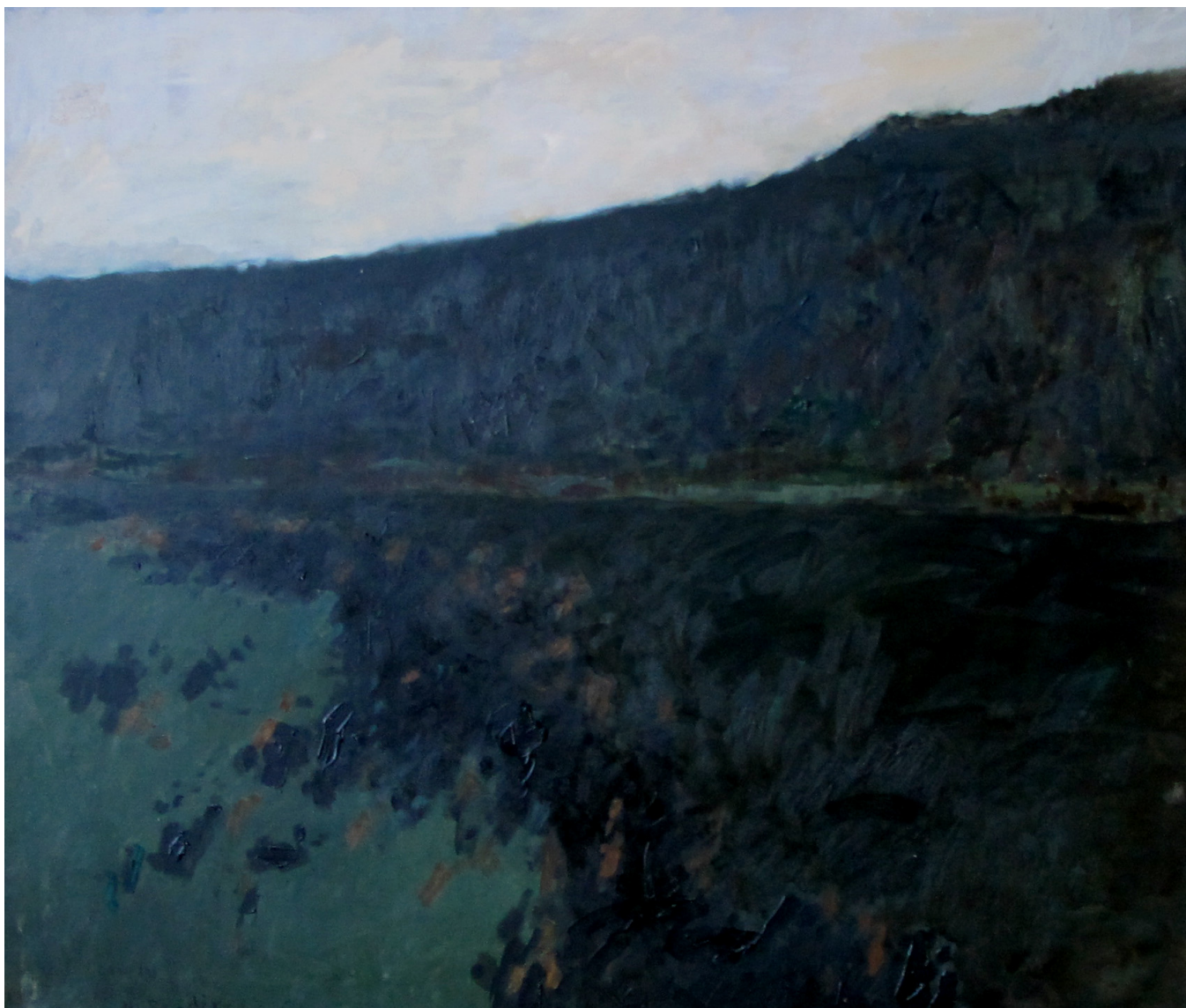
Bondivann kl 04.00 (92x80)