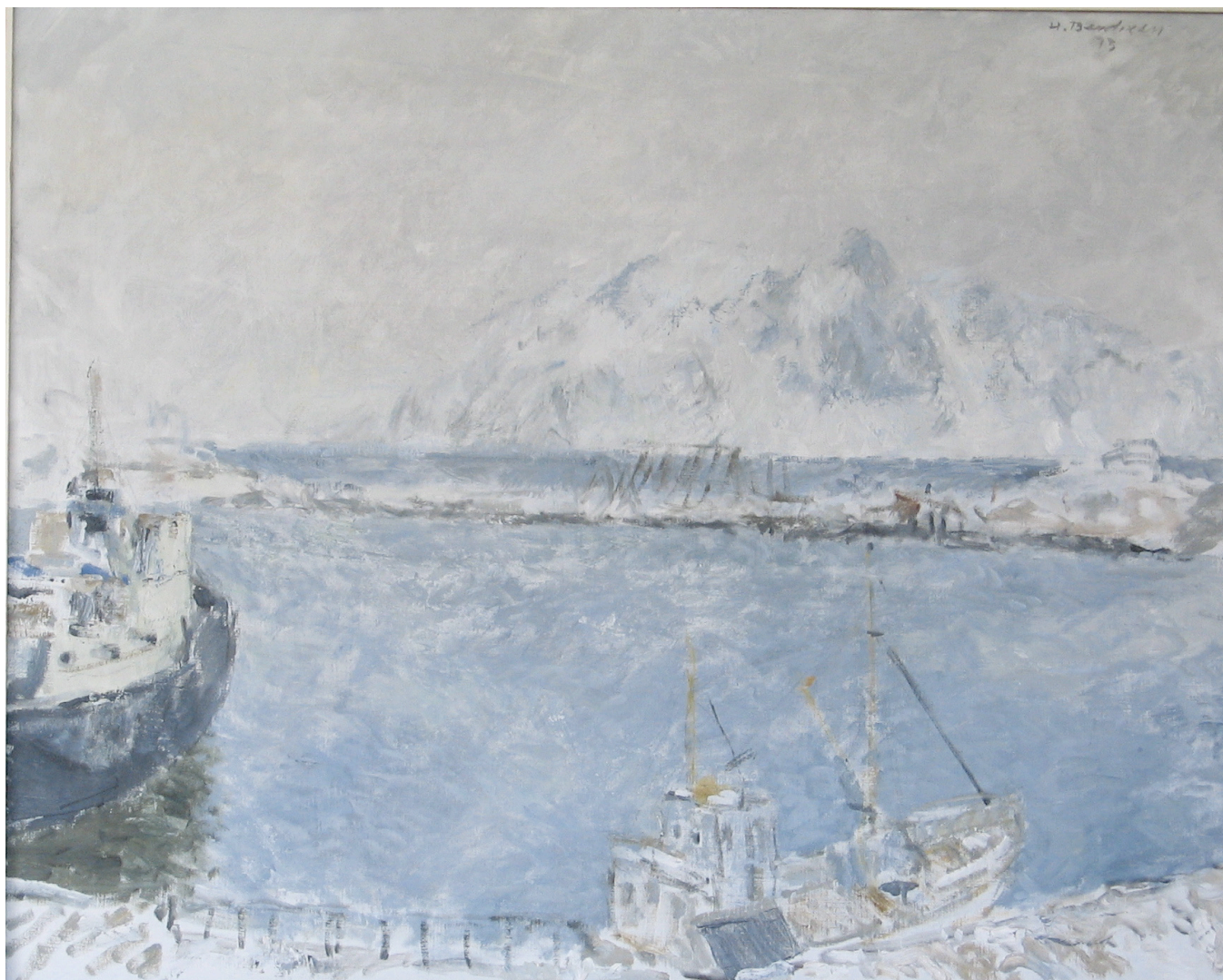
Fra Reine 1973 (92x72)

Vekslingen mellom motivene, fra Lofotens monumentale dramatik til Askerbygdas mer jordnære virkelighet, ga spennvidde i hans kunst. Hver vår oppsøkte han gjerne sine barndomstrakter i Reine i Lofoten for å male der. Resultatet ble ofte lysere, storslagne vinterbilder med snø i lufta. Man føler den kjærlighet han alltid hadde til sine hjemlige trakter, gjennskapt på en inderlig og intim måte gjennom antydningens kunst. Her skimtes også et aktivt fiskermiljø mellom høye, spektakulære fjell og med snødrev i lufta.