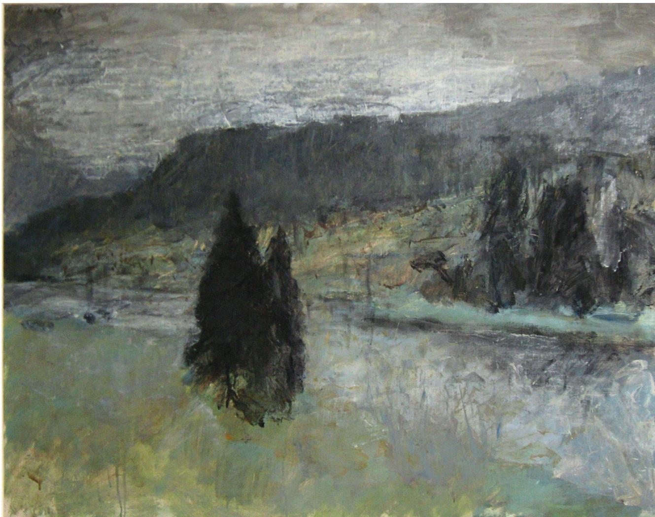
Ved Bondilia 1961 (75x96)