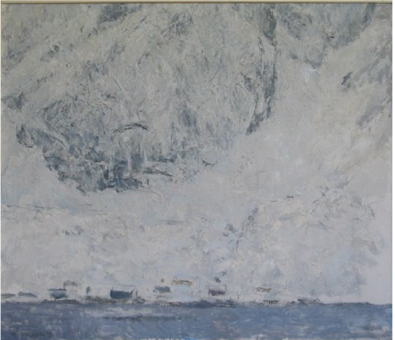
Reine bringen 1976 (70x60)