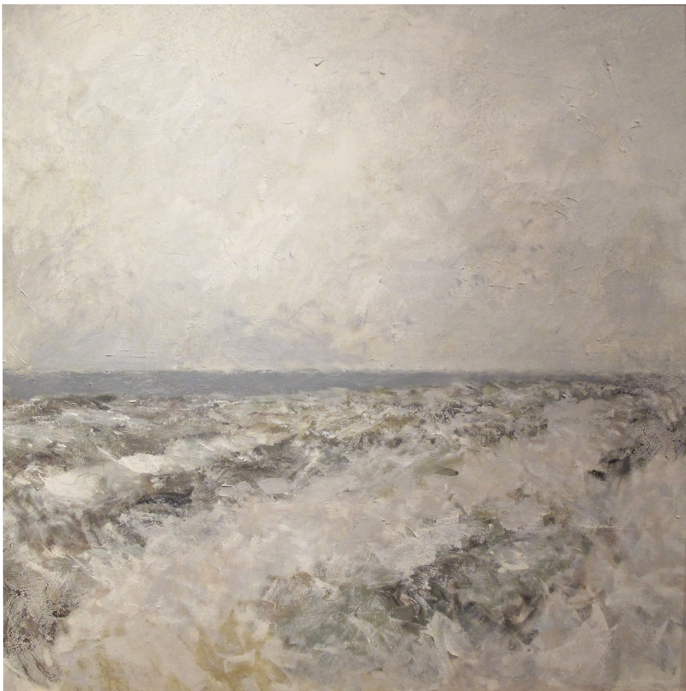
Lofoten Munkehagen 1976 (117x117)