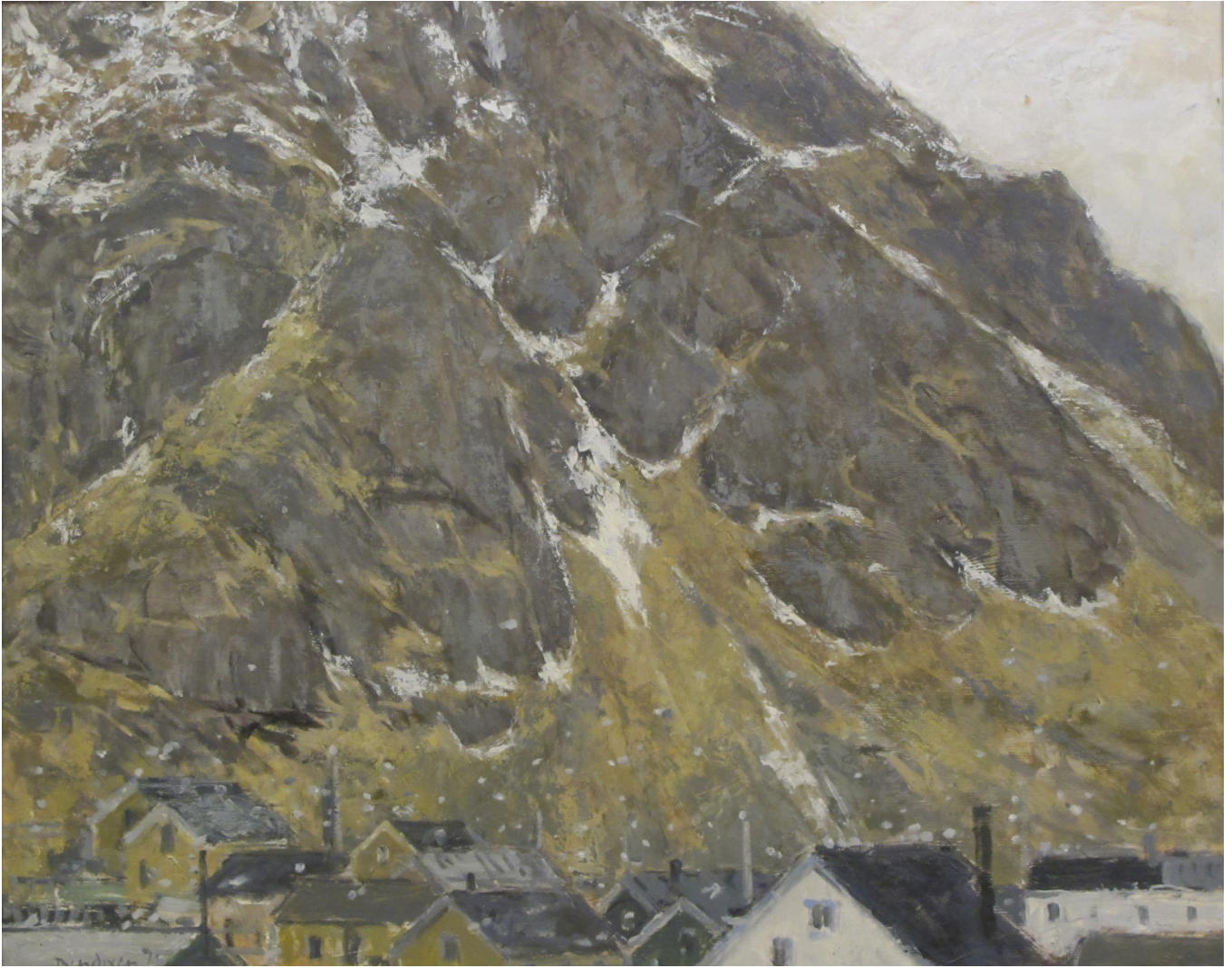
Å i Lofoten 1975 (75x63) (Vurderes solgt)