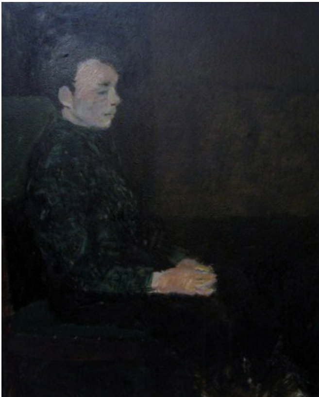
Bend 1966 (80x100)