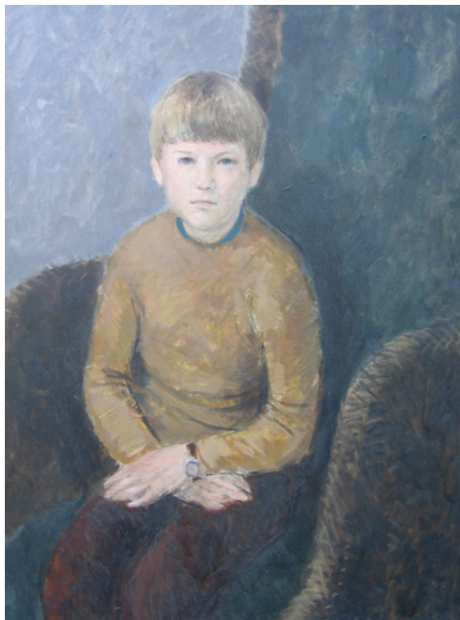
Ung gutt 1974 (74x96)