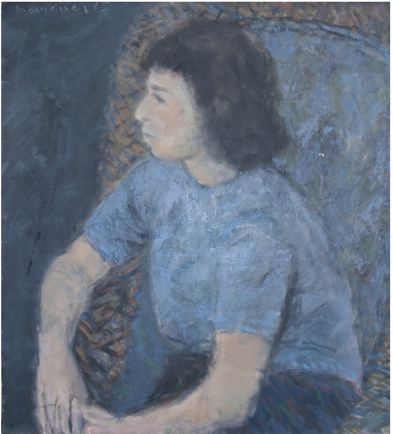
Grete 1965 (60x65)