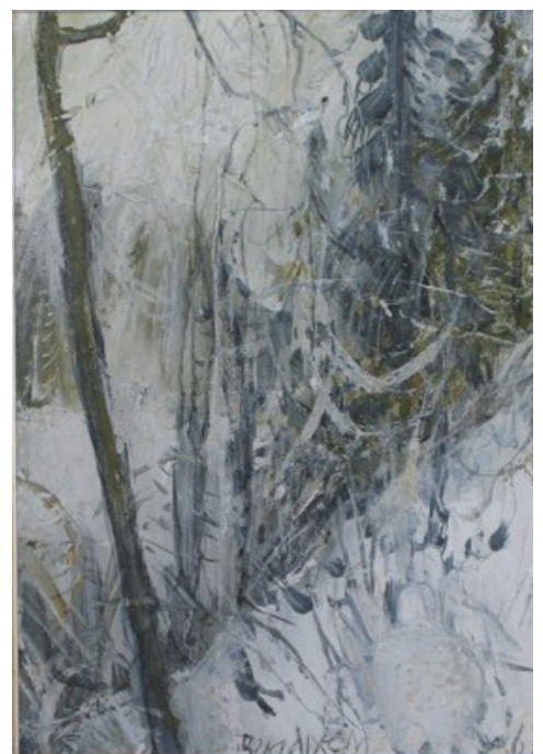
Vår 1967 (19x26)