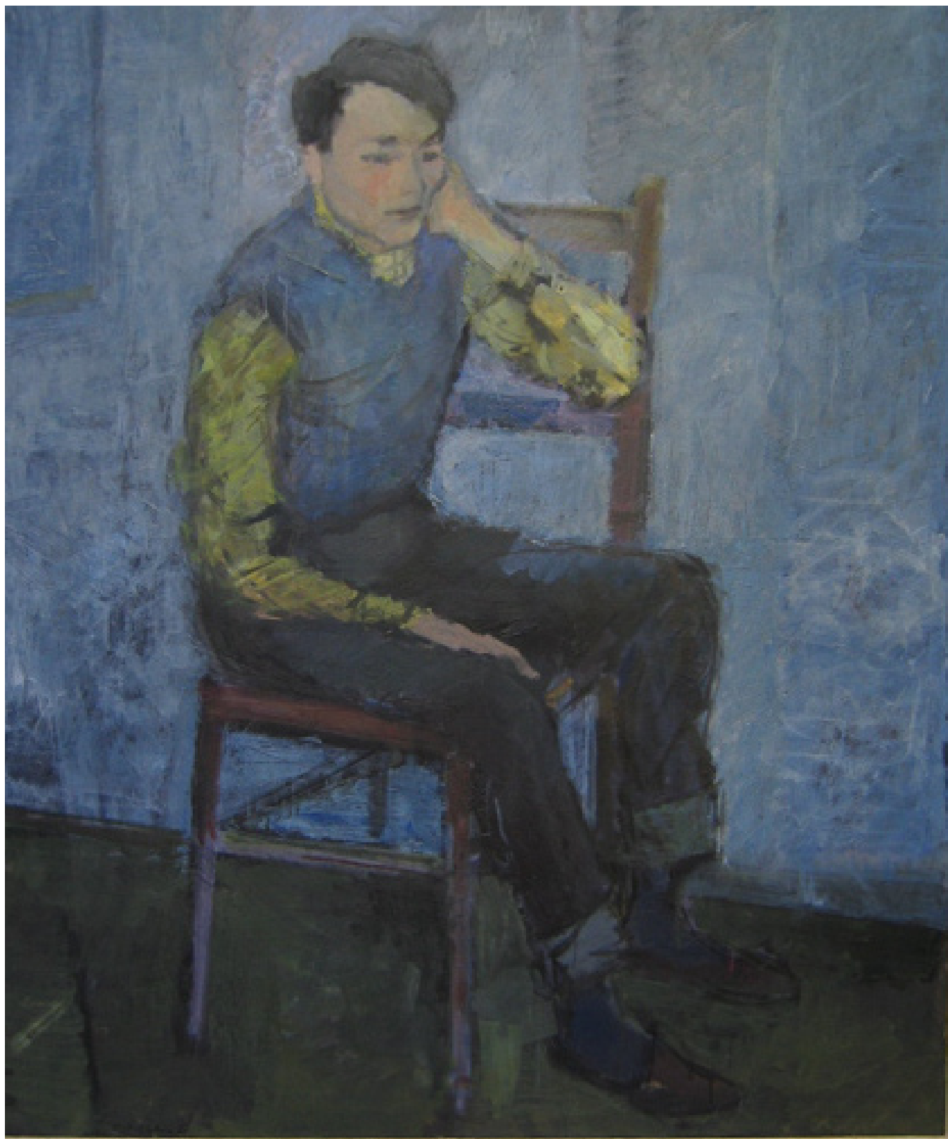
Bend 1960 (130x160) (Vurderes solgt)