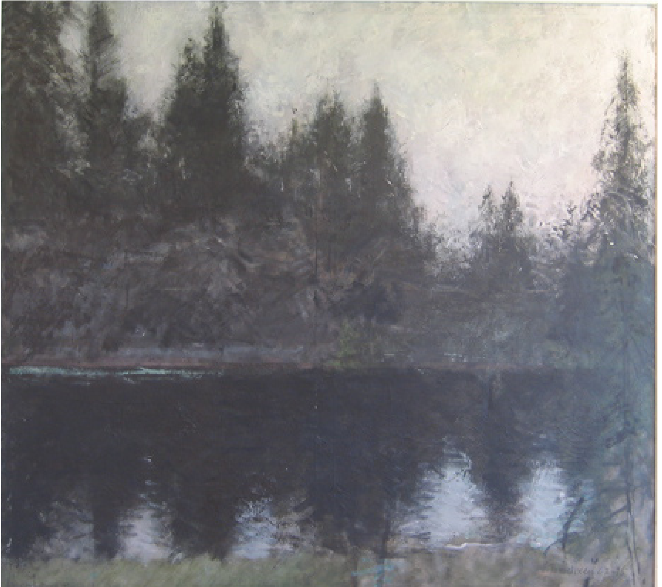
Ensomhetens tjern 1962 – 1975 (140x120)

”Hans melankolske, mørke stemningsbilder fra naturen fikk en egen malerisk og stofflig nerve som ble hans varemerke.