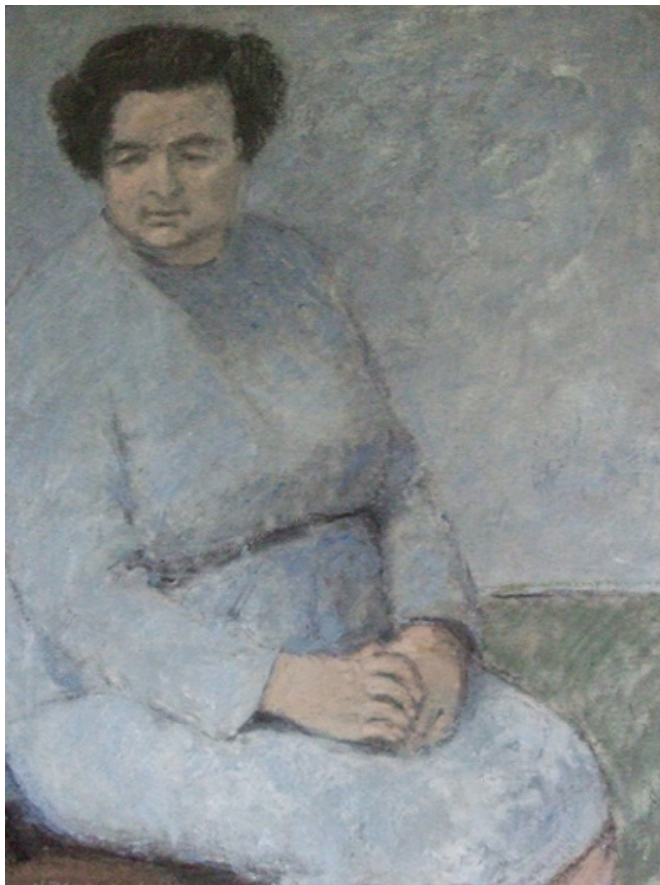
Forfatterinne Zinken Hopp 1967 (70x100)