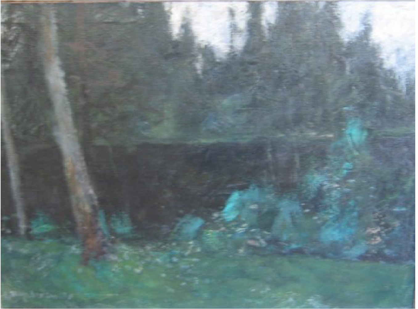
Ved Bondivann 1970 (56x120)