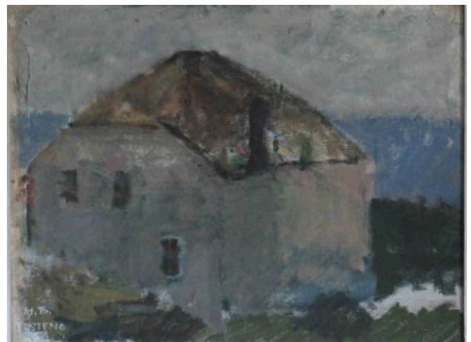
Jugoslavia 1966 (50x38)