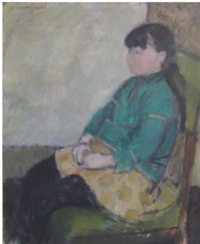
Dora 1961 (80x100) (Vurderes solgt)

Til slutt gikk den fra hverandre i flettingen og eksisterer ikke lenger.”