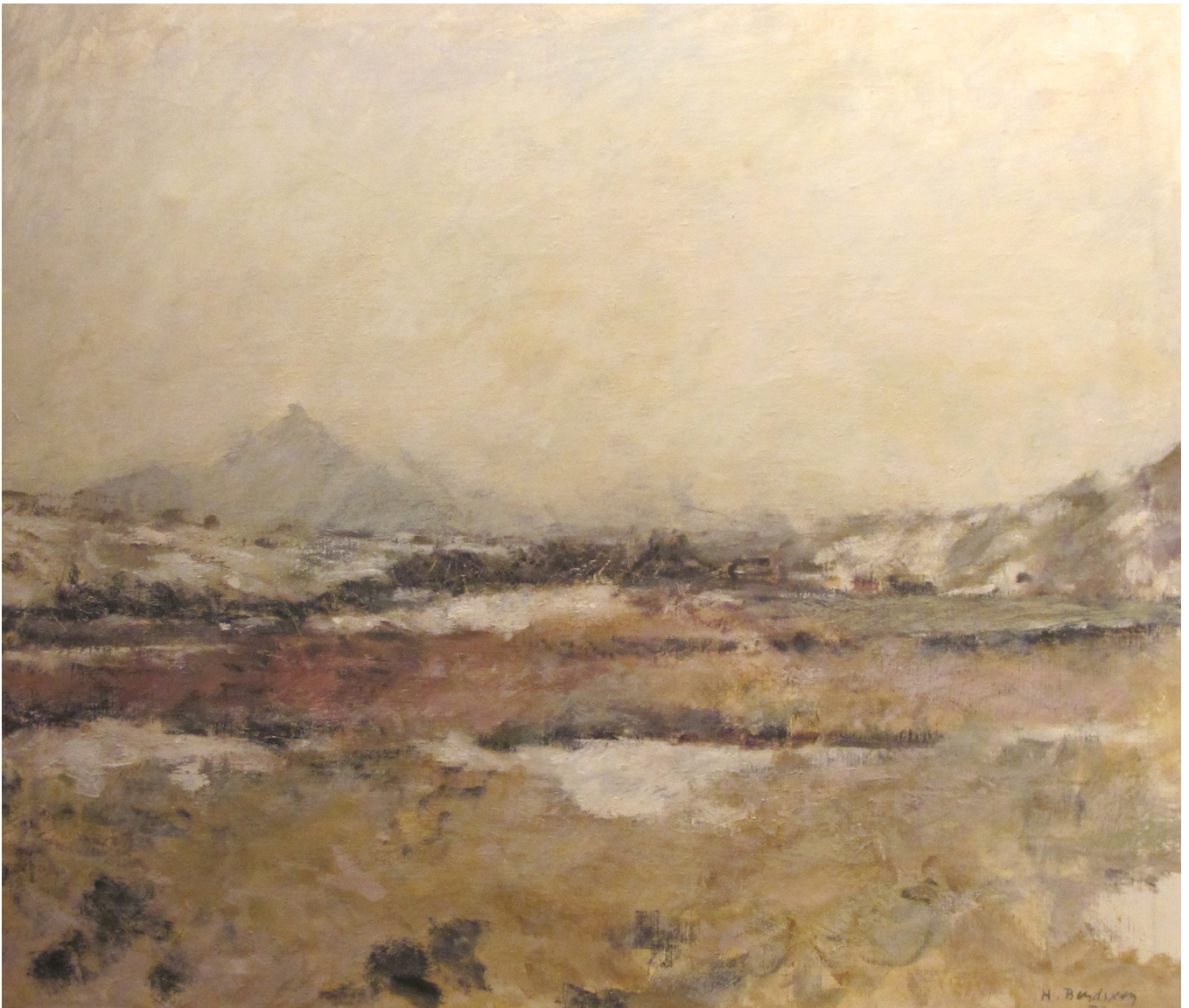
Barfrost Lofoten 1972 (80x70)