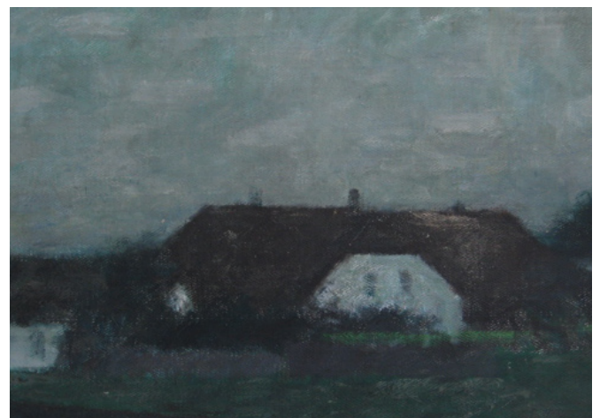
Fra Danmark 1970 (99x64)