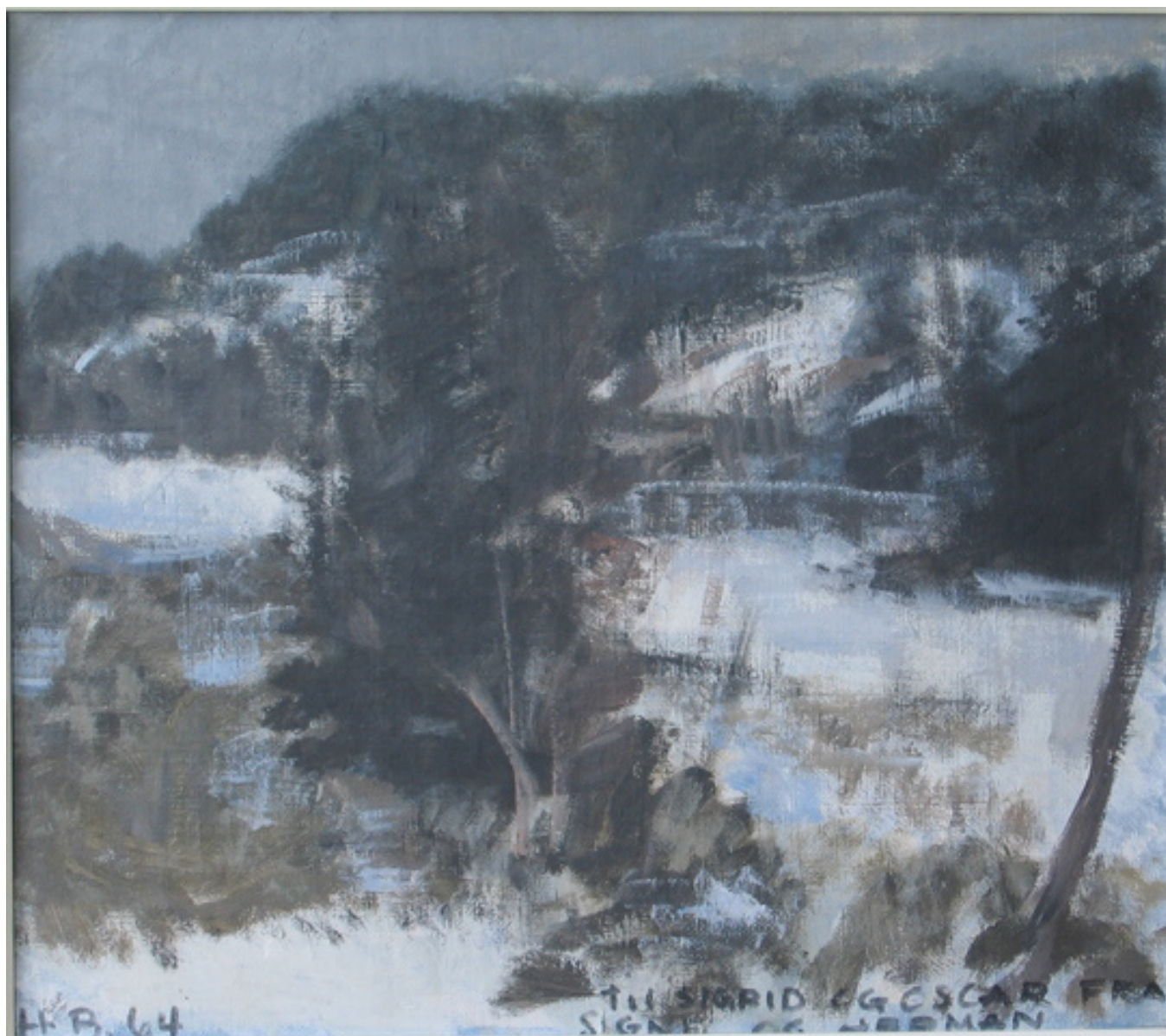
Bondilia 1964 (35x30)