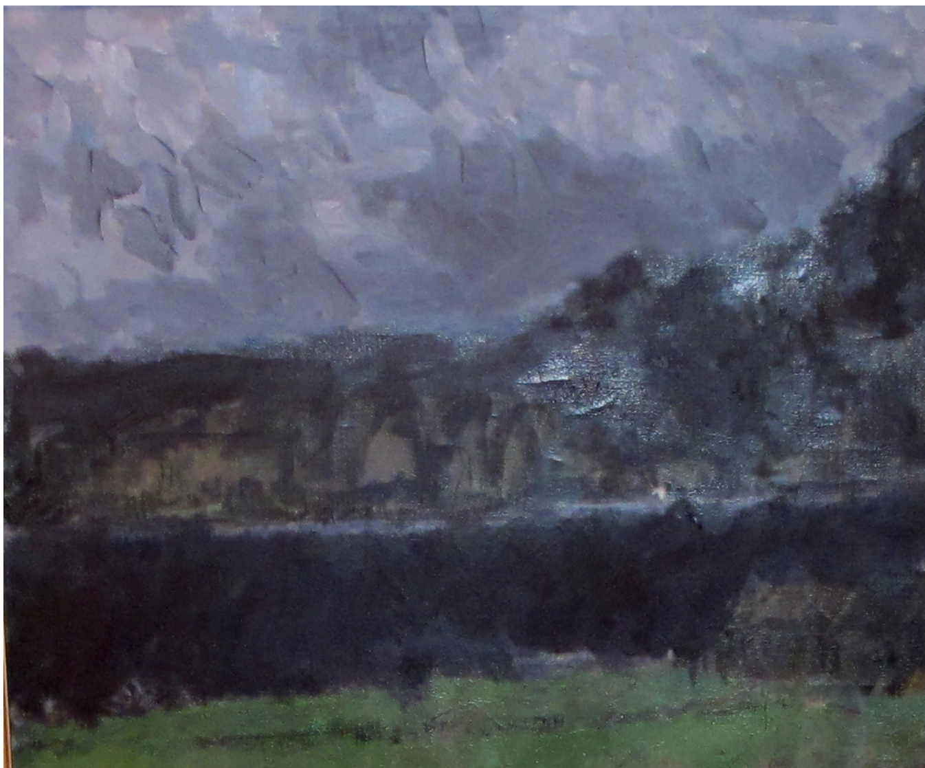
Telemark 1975 (80x72)