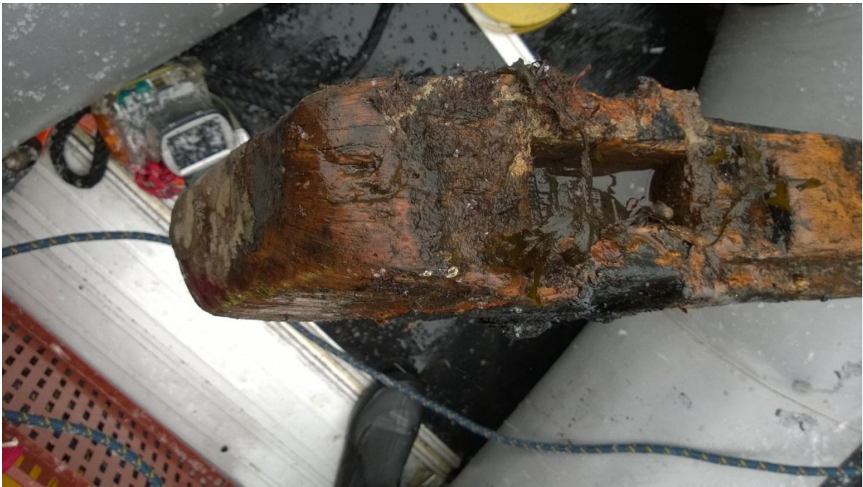
Figur 2 Feste for akterstevn på kjøll. Askeladden ID 175361 – 1.