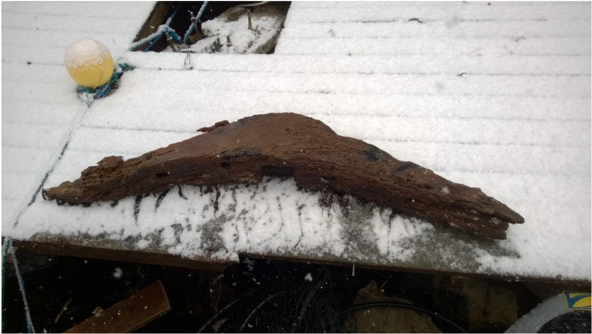
Figur 1 Bunnstokk fra klinkbygd fartøy Askeladden ID 175361 - 1.