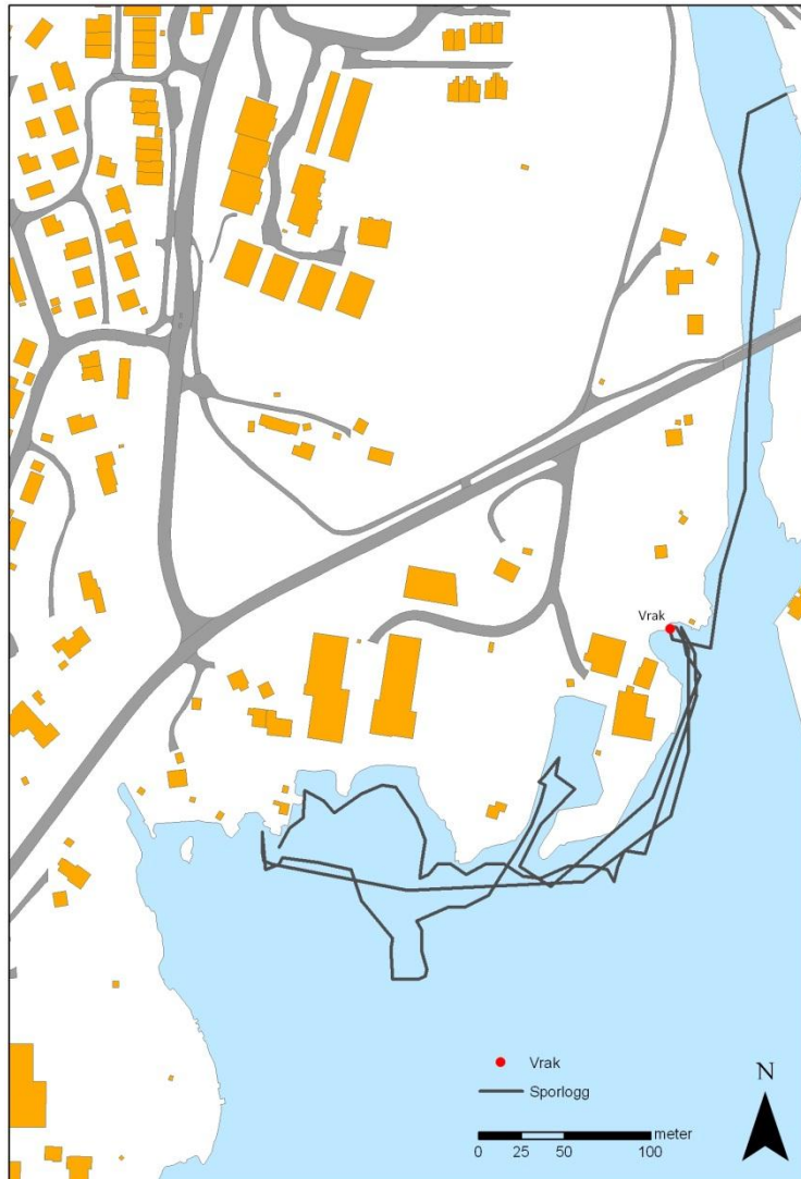
Figur 4 Sporlogg. Håndholt GPS i båt. Dykkeren befinner seg vanligvis lenger unna og det må tas forbehold om posisjonsavvik. Det var god sikt den aktuelle dagen. Minst 20 meter.