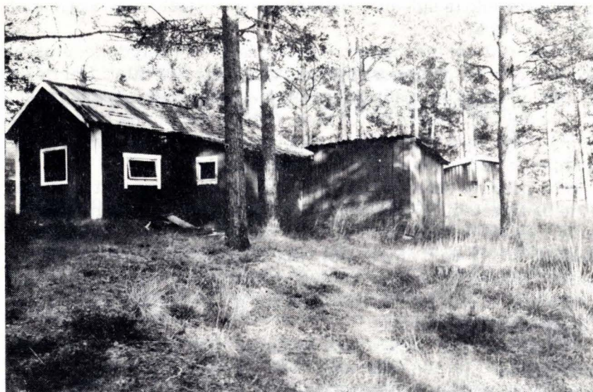
Grishus og sauefjøs ovafor brakkebyen.

sauer, slik at dei «spann og batt på ryssen» sjølv. Gras til vinterfor slo ei mellom anna rundt brakkene. Nokre hadde sau heilt fram til 1965.