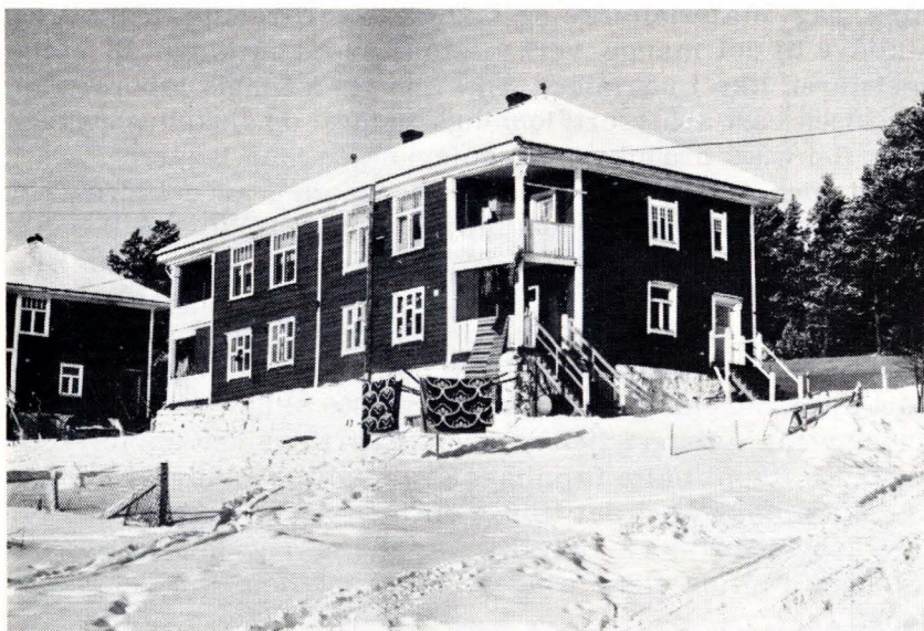
Frå brakkebyen.

småhandverk eller jakte rype. Men svært mange flytta nordover til andre gruver, mellom anna til Kåfjord i Alta. På denne tida vart og mange av dei beste sæterrettane selt unna til alvdølar.