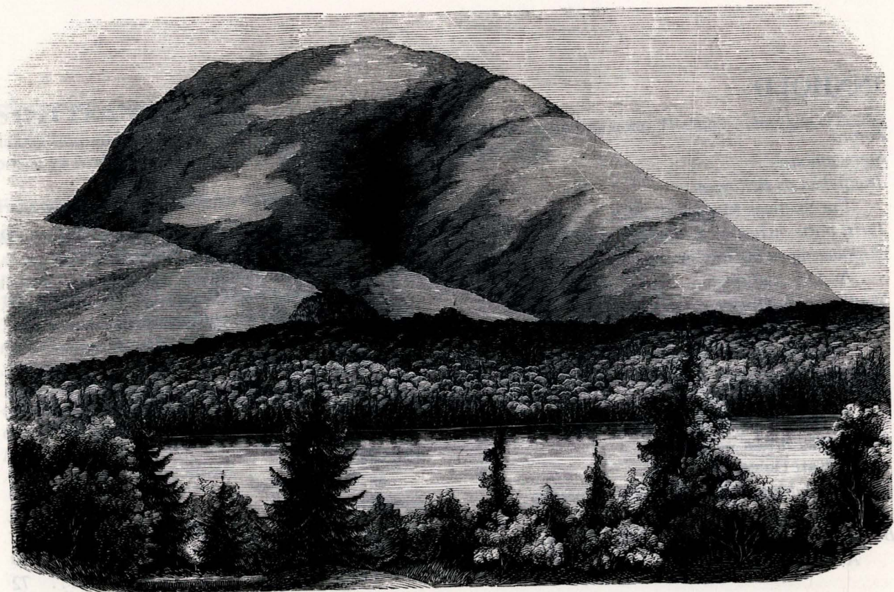
Ironsjeld i Lunset.