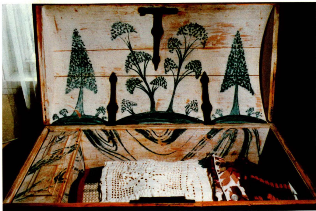
F 14. Kiste, innside, fra Stor-Norsa, Vingelen, malt av Esten O. Røe 1836

perioden i Østerdalen varer i vel tredve år. Sønvis tar i rosemalingen opp elementer fra svensk bonadsmaleri, men det ser vi ikke på motivene i kistemalingen.