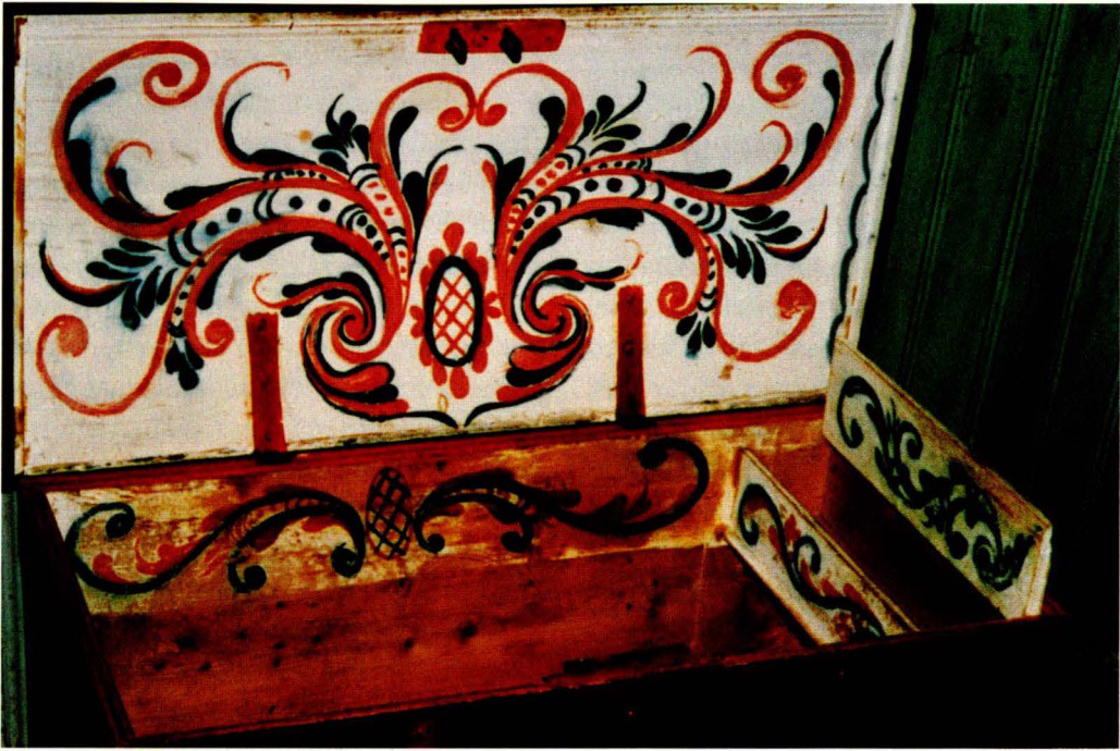
F 8. Kiste, innside, fra Tolga malt av Jon S. Østgaard