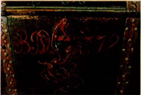
F 3. Kiste, lokk innvendig, utvendig lokk og front, fra Vingelen. Malt av Solan J. Østgaard 1778