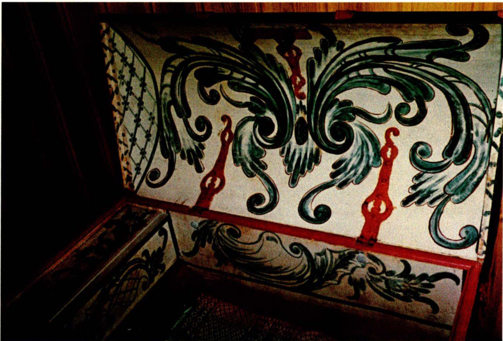
F 9. Kiste, innside, fra Os malt av Sonvis Olsson 1803