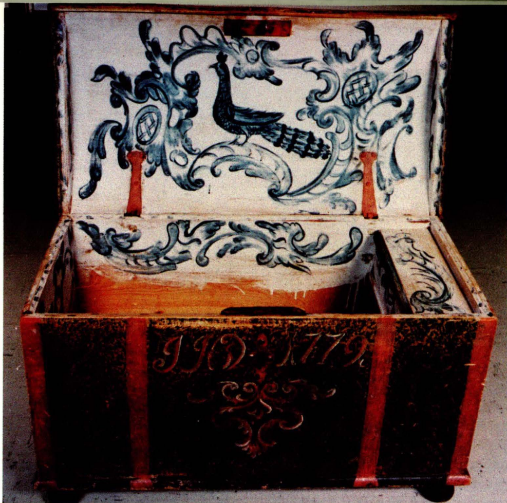
F 4. Kiste fra Os malt av Solan J. Østgaard 1779