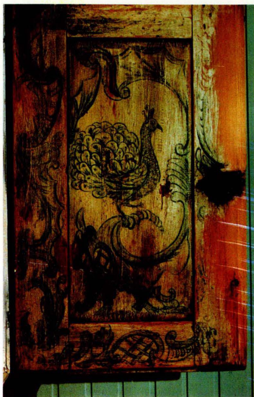
F 5. Matskap, innside dør, fra Vingelen, malt av Solan J. Østgaard 1778

og sammenføyninger er forsterket med jernbeslag. Båndene har også en dekorativ hensikt. Denne planveggete, senbarokke kisten er det som blir rose malt i bygdene. Skikken med medgift varte ved i bygdene like til vårt århundre, og så lenge tradisjonen var levende hadde også brudekisten sin funksjon.