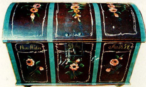
F 11. Ovenfra og nedover: Kiste fra Vingelen oppmalt, kiste fra Tolga, kiste fra Tolga med senere overmalt navn. Alle malt av Bedokken 1826

retningene, og Ivar Kleiven skriver om samhandel mellom Gudbrandsdalsbygder og Røros og om «Røyrosveigen» mellom