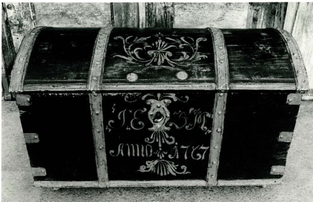
F 1. Kiste fra Os malt av Solan J. Østgaard 1767

vanlige for tiden. Møbelmaleri er relativt nytt og er i seg selv en begivenhet. Kistemalingen kan være eldre i området for ikke alle gamle kister er registrert. Tidligere var møblene i det store og hele trehvite og kunne være dekorerte med ulike former for skjæring, ha snekkerornering og/eller være staffert for ulike formdeler.