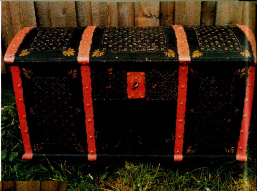
F 7. Kiste oppmalt til sønnen Soland av Jon S. Østgaard 1827