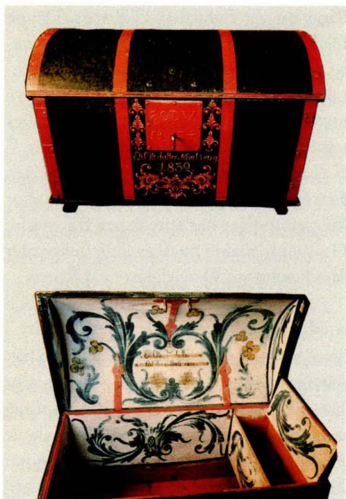
F.12. Utstyrskeiste fra Dalsbygda, snekret 1824, malt av Sønvis O. Holemoen 1832