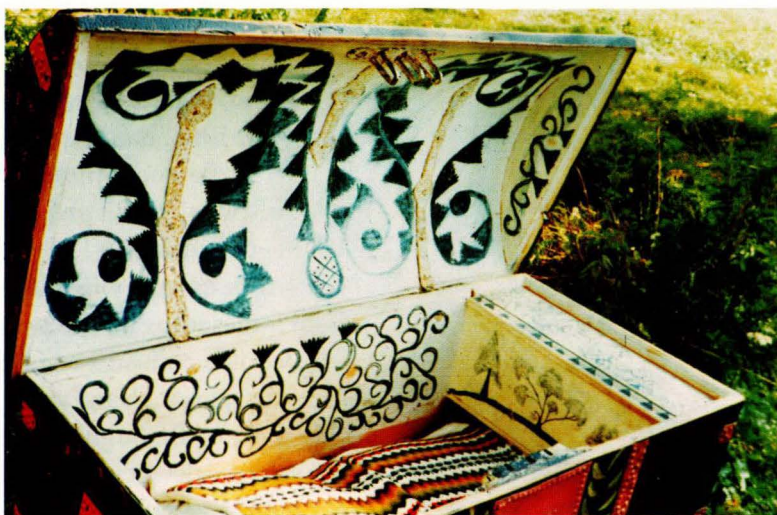
F 17. Kiste, innside, fra Os malt 1837

(1) Spesielle opplysninger om vårt område er dokumentert i egen avhandling «Dekorativt interiørmaleri i hjemmene i Os og Tolga fra 1740- til 1840-tallet», 1980, for dr. ing.-graden i arkitekturhistorie ved NTH, Universitetet i Trondheim.