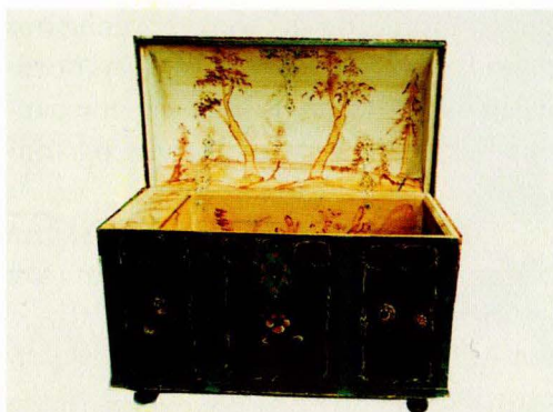
F 239, g 141. Kiste. Bedokken 1826. Vingelen. F 240, g 142. Kiste. Bedokken 1826. Tolga. F 241, g 143. Kiste. Bedokken 1826. Årstallet overmalt. T