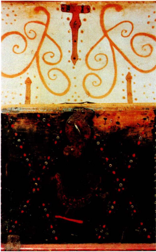
F 16. Kiste, midtfelt, fra Tolga malt 1819.

Bedokkens tradisjon på 1820- og 1830-tallet (f 15). Simen Andersønn Gjelten (1809-95) fra Hodalen rosemalar fram til 1870-årene med motiver som ligner Sønvis` i utformingen. Han har brukt innskriftsfeltet med småornamenter mot hvit grunn midt på kistefronten. En malar «til husbruk» har plassert en fugl midt i fronten, en annen lager en original utgave av rankemalingen (f 16, 17). Ikke alle malere i regionen er nevnt.