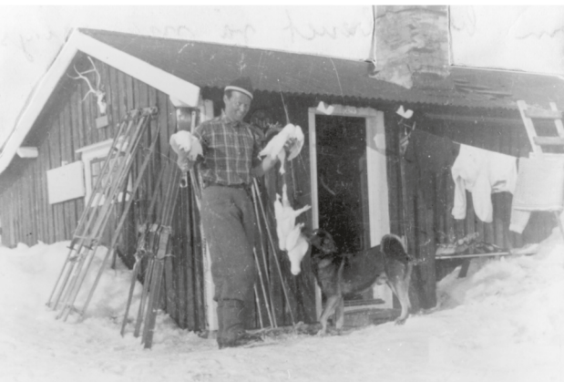
Tabu i mataukingens dager.