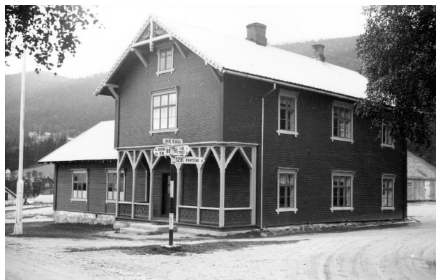
Kirkestua i Øvre. (L6782)

sakene (som vold, tyverier, ærekren-kelser osv.) og latt andre saker om sivi-le tvistemål ligge. Men det er uten tvil et meget stort og omfattende arbeid Bull har gjort ved å bruke rettsmateria-le til å belyse alle livets sider på 1600- og begynnelsen av 1700-tallet. Flere ganger bruker han utdrag fra rettsfor-handlinger for å beskrive både økono-miske og kulturhistoriske aspekter i bygda. Det virker i det hele tatt som om han har lagt en større innsats i å gå igjennom dette eldste materialet. Kanskje ble kildetilfanget for omfat-tende utover på 1700- og 1800-tallet til at han maktet å gå igjennom alt dette med like stor nidkjærhet. Da var han jo også kommet over i en periode da han kunne bygge på en annen rikholdig kilde, nemlig alle muntlige overleve-ringer og de skikker han hadde opp-levd som barn. Også her må man si at han har gjort et omfattende arbeid for å skrive ned og bevare en muntlig tra-disjon for etterslekten.