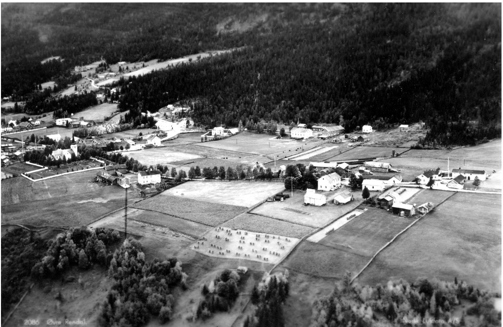
Øvre Rendal. Foto: Norsk Flyfoto. (15026) Repro: Musea i Nord-Østerdalen.

Et annet interessant moment med Bulls forfatterskap er hans folkelivsskildringer og den nærheten disse har til faktiske personer og hendelser. Jeg vil derfor også gi en karakteristikk av folkelivsskildringene som historiske beretninger, og også hvilken reaksjon disse skapte i lokalsamfunnet.