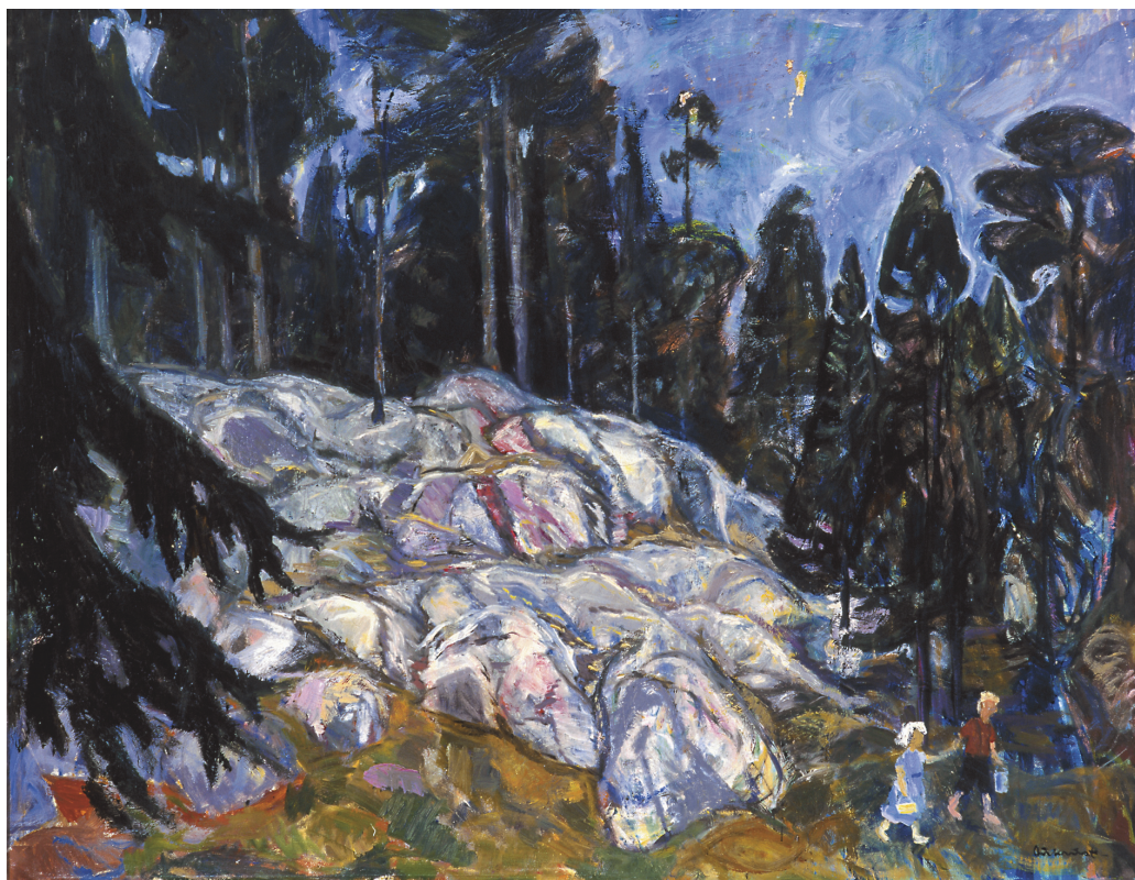
Barna i skogen, 1943. Olje på lerret. Med dette måleriet debuterte Kjell Aukrust som målar på Statens haustutstilling i 1945. Eigar: Aukruststiftelsen.