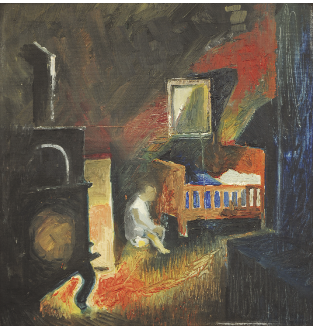
Nattpotta, ca. 1935. Olje på lerret.

Etter kvart som det vart kjent gjennom media at vi arbeidde med utstillinga, vart vi kontakta av fleire som hadde eller visste om Aukrustmåleri og som med stor velvilje har lånt oss bilde og delt opplysningar om bilda med oss. Resultatet vart ei utstilling som vi er stolte av og som er viktig dokumentasjon av Kjell Aukrusts kunstnarskap i unge år. Og den unge kunstnaren imponerer. I svært ung alder er han tydeleg inspirert av store forbilde og opptatt av komposisjon, av lys og av farger. Da han var 15 år måla han Nattpotta. På baksida av bildet har Kjell sjøl notert følgjande: Mitt første maleri, ca. 1935. Bildet bærer tittelen "Nattpotta". Bemerk den røde glød fra "Bjørneovnen" .