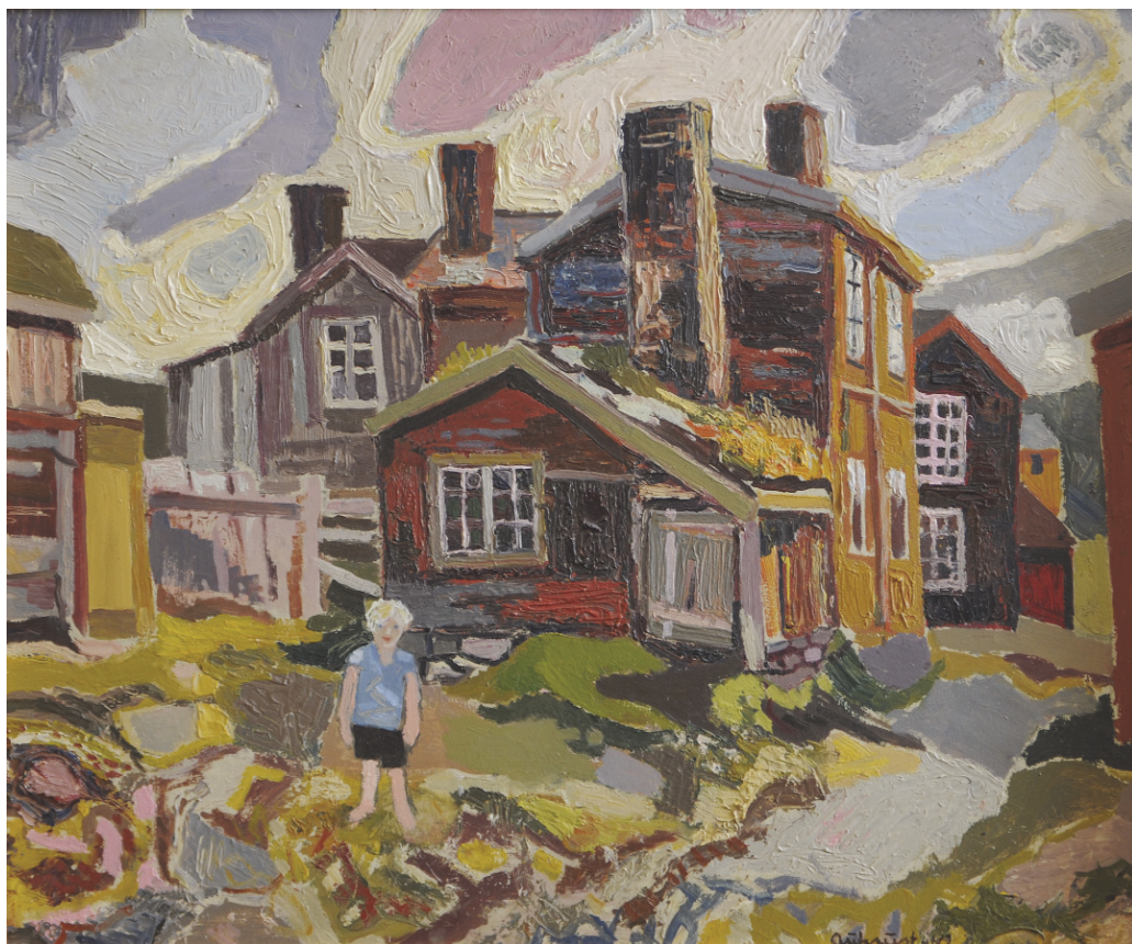
Frå Røros, 1942. Olje på plate.