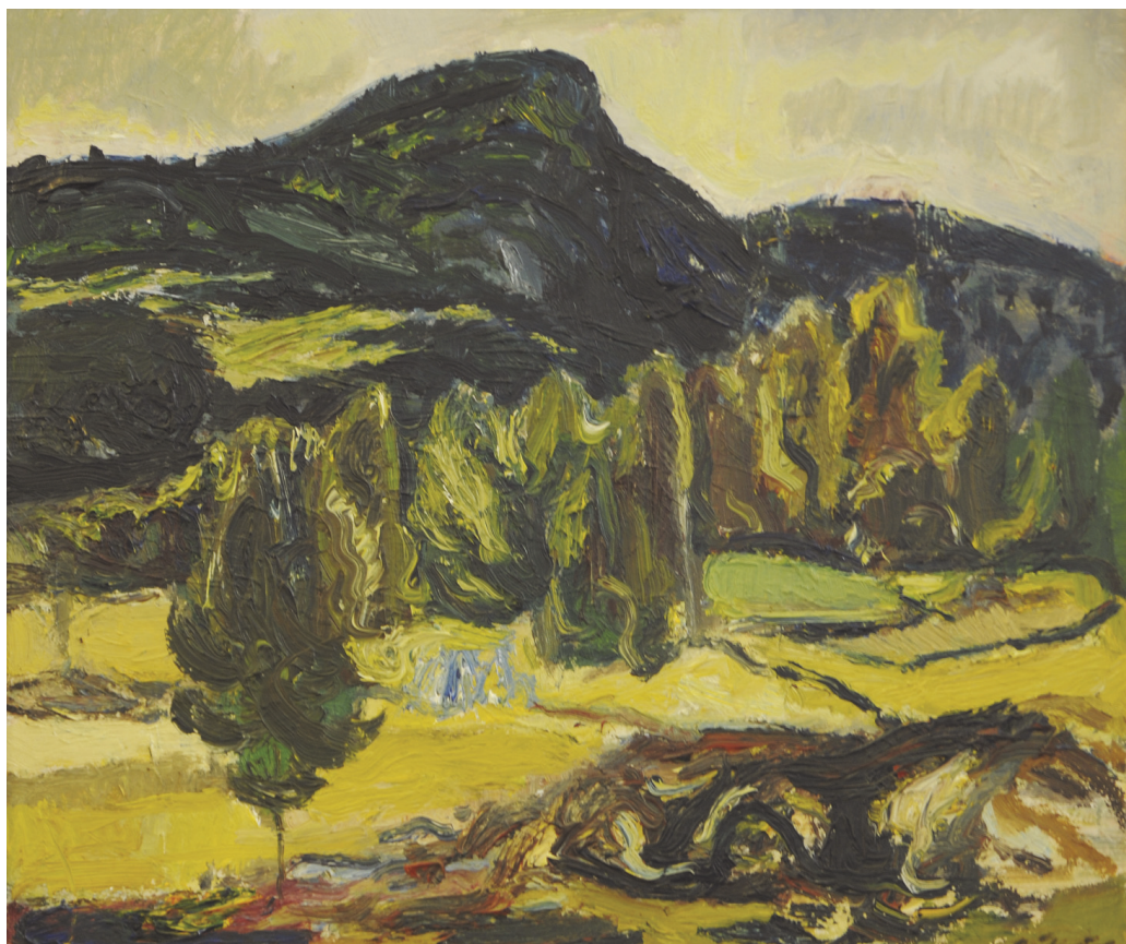
Sten, Alvdal, årstall mangler.