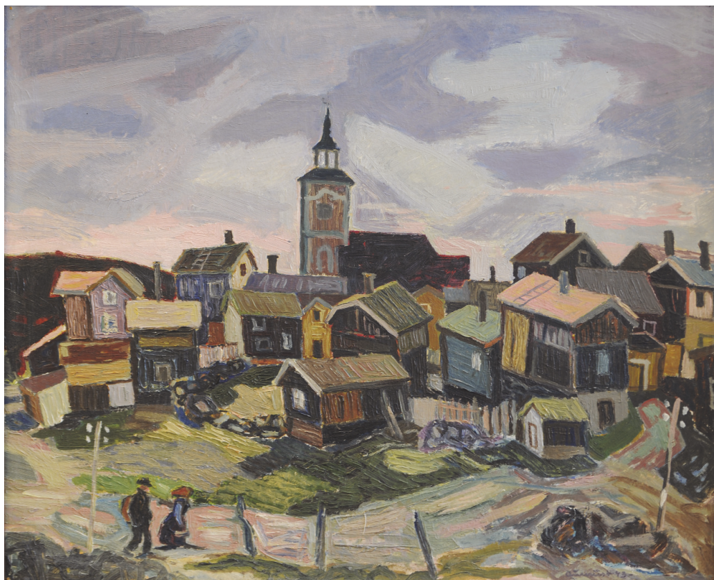
Røros med kyrkja, 1943. Olje på plate.