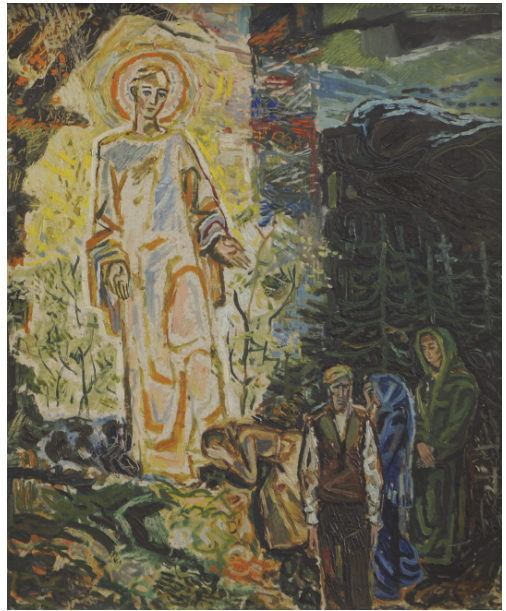
Skisse til altertavle i Sollia kyrkje, 1942. Olje på plate.

Med utstillinga Den unge Kjell Aukrust , har vi presentert eit utval av det Kjell Aukrust måla i sine unge år, men vi er sikre på at det fins mye meir. Det har vore ei glede å vise fram denne utstillinga som kompletterer bildet av ein mangfaldig og svært produktiv kunstnar. Og vi tar framleis svært gjerne imot informasjon om måleri av Kjell Aukrust.