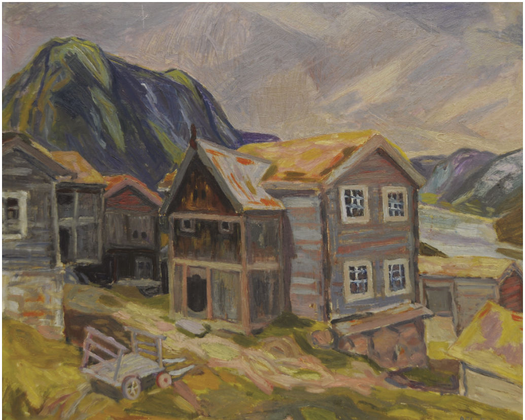
Skjæsar i Lom (i bakgrunnen Lomsegga og til høgre Skim), 1943. Olje på plate.