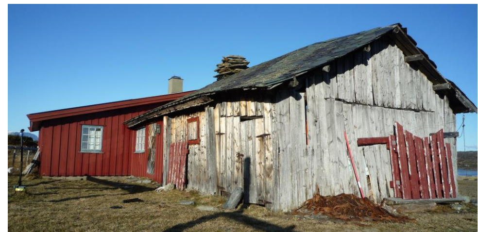
Endring etter behov