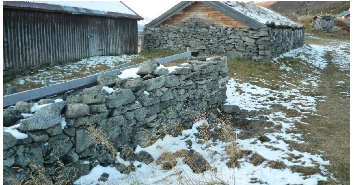
Stein som byggemateriale