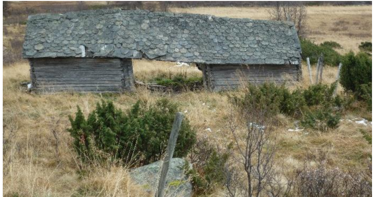
Arklåvar og dobbeltlør