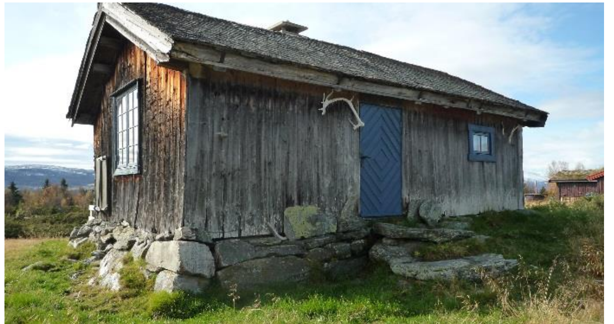
Todelt sel med mjølkebu i ei lengde – eit fråflytta og eit i bruk