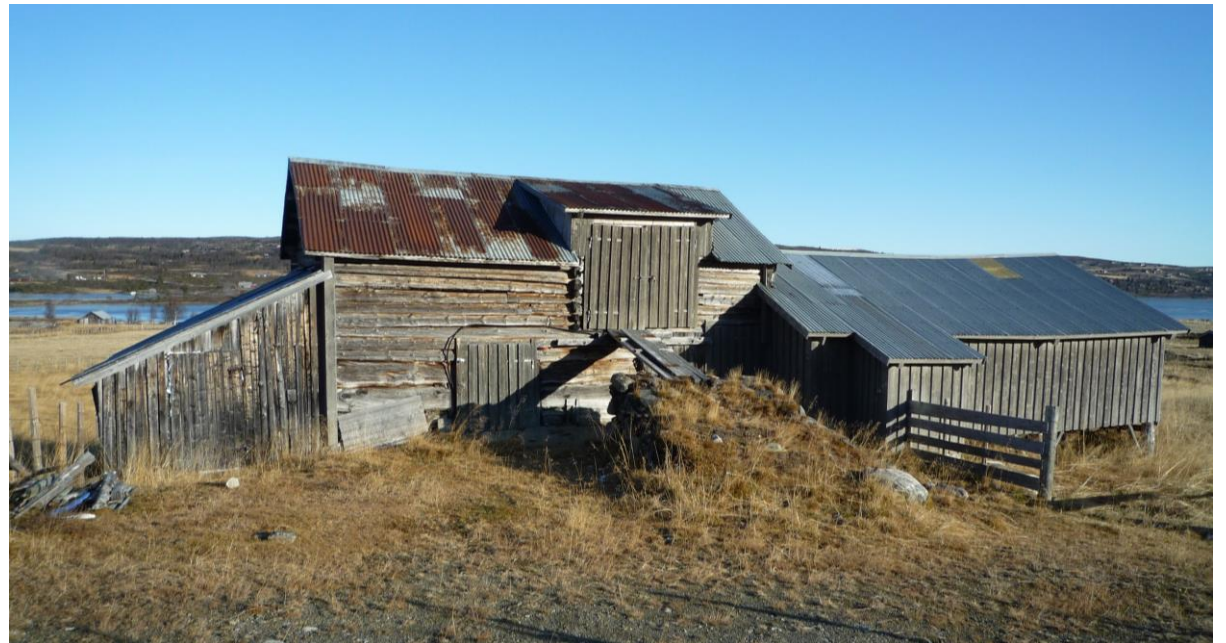
Utbygging etter behov