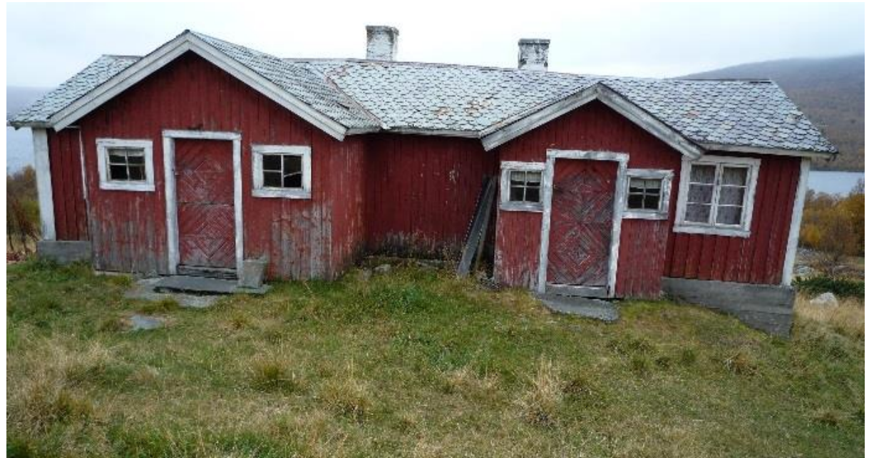
Sel med to inngangar