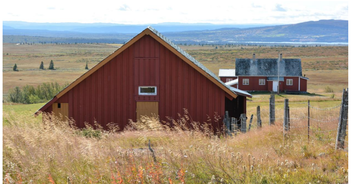
Fjøs i reisverk