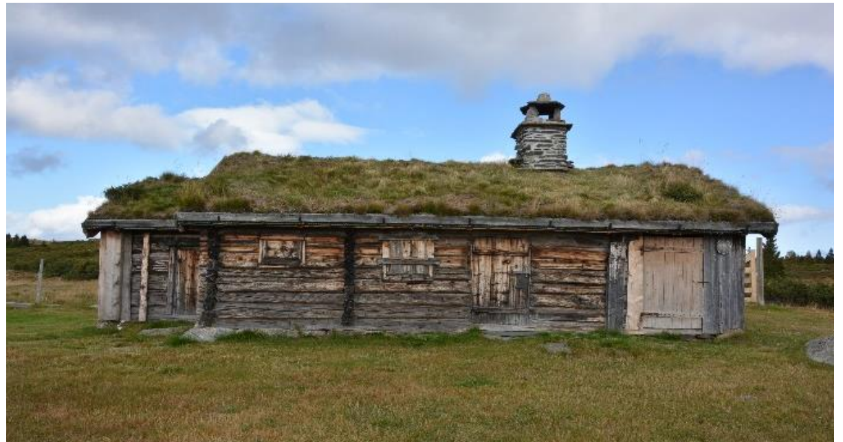
Todelt sel med utbu (sel/mjølkebu/utbu)