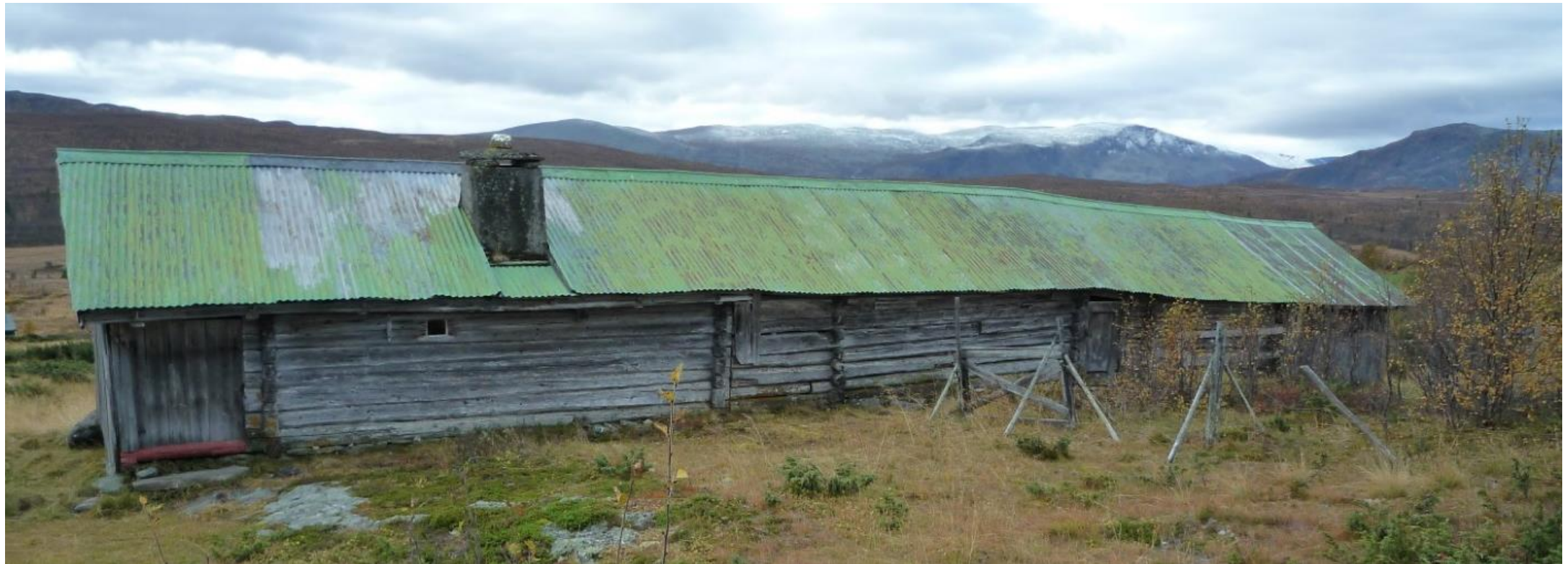
Sel i fire-fem lengder (skut, sel, mjølkebu, fjøs)