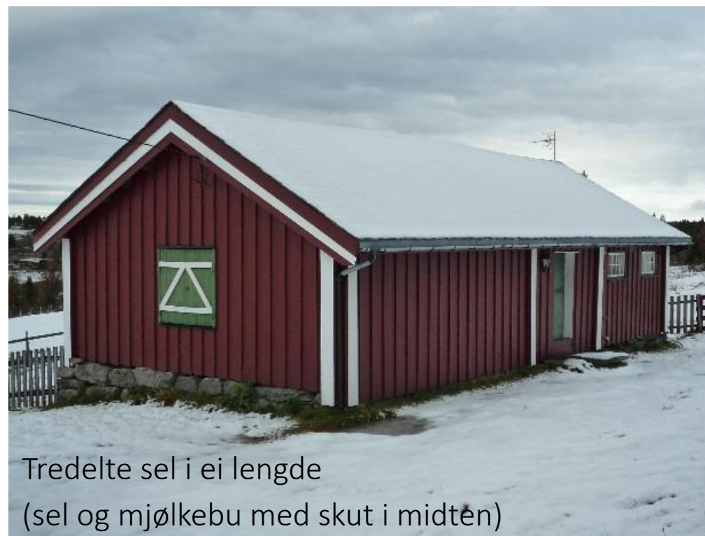
Tredelte sel i ei lengde (sel og mjølkebu med skut i midten)