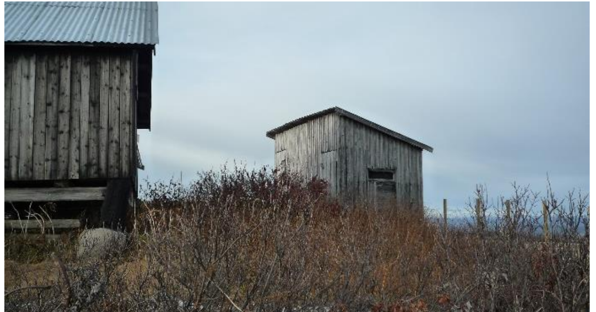
Mjølkeavkjølingar og -ramper