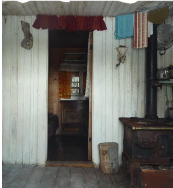
Ristestølen frå 1900-talet – med det minste selet