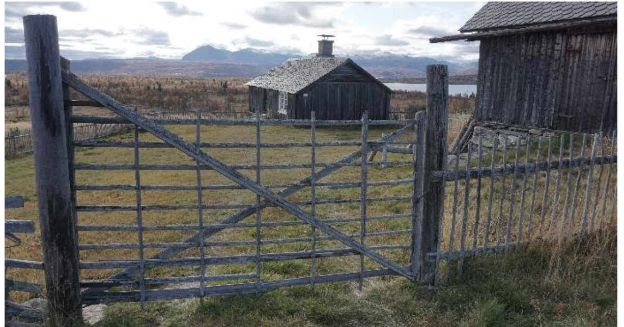
Gjerder av tre