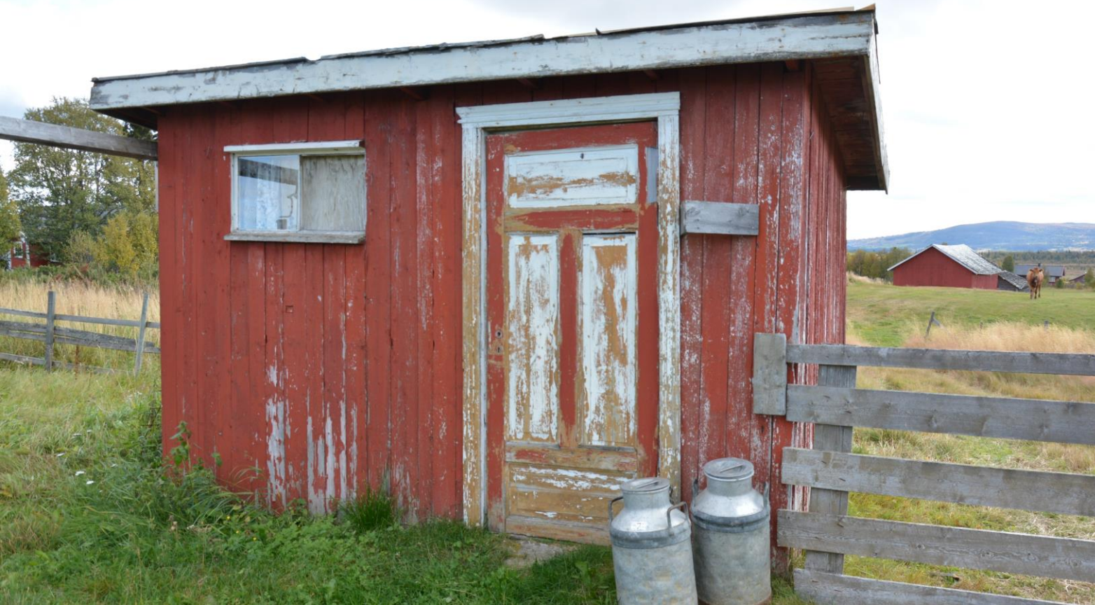
Mjølkebuer og vedskålar