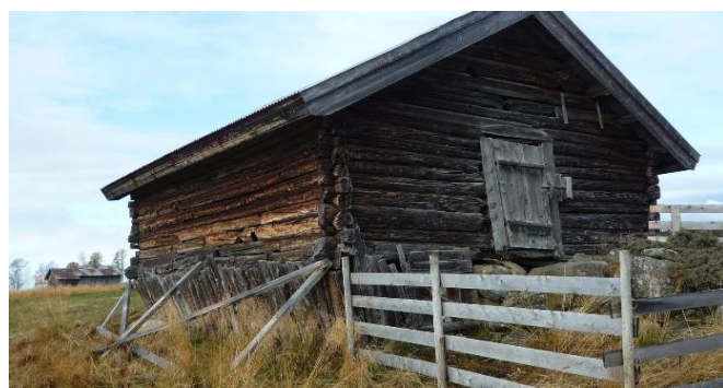
Fjøs i ei lengde