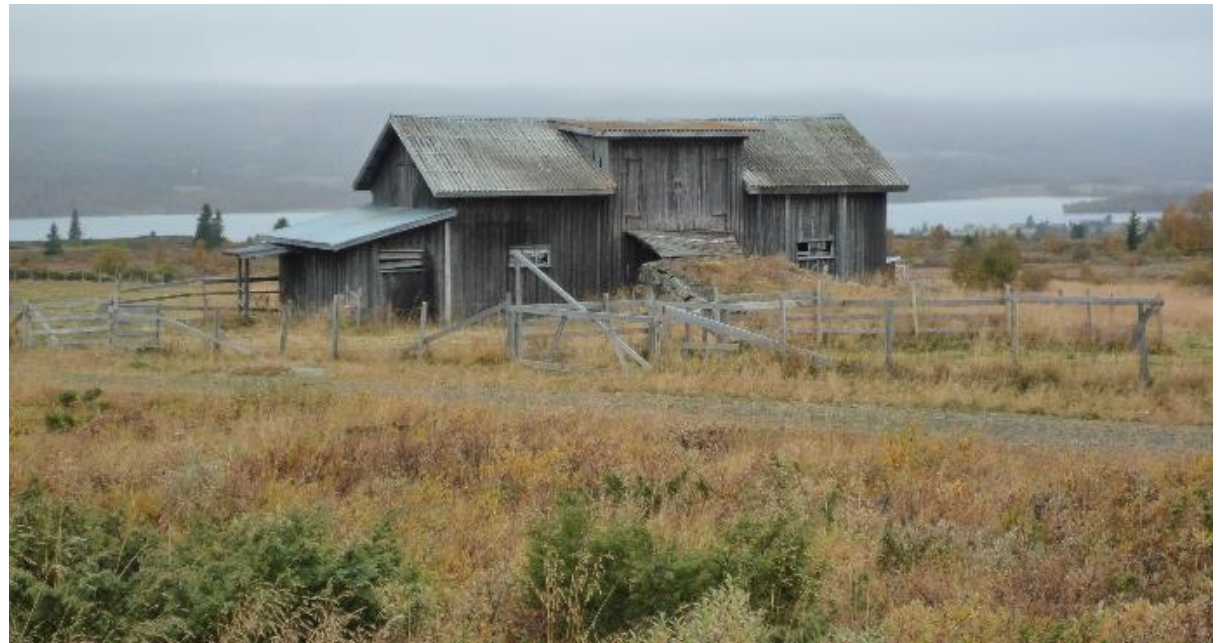
Låvar i reisverk