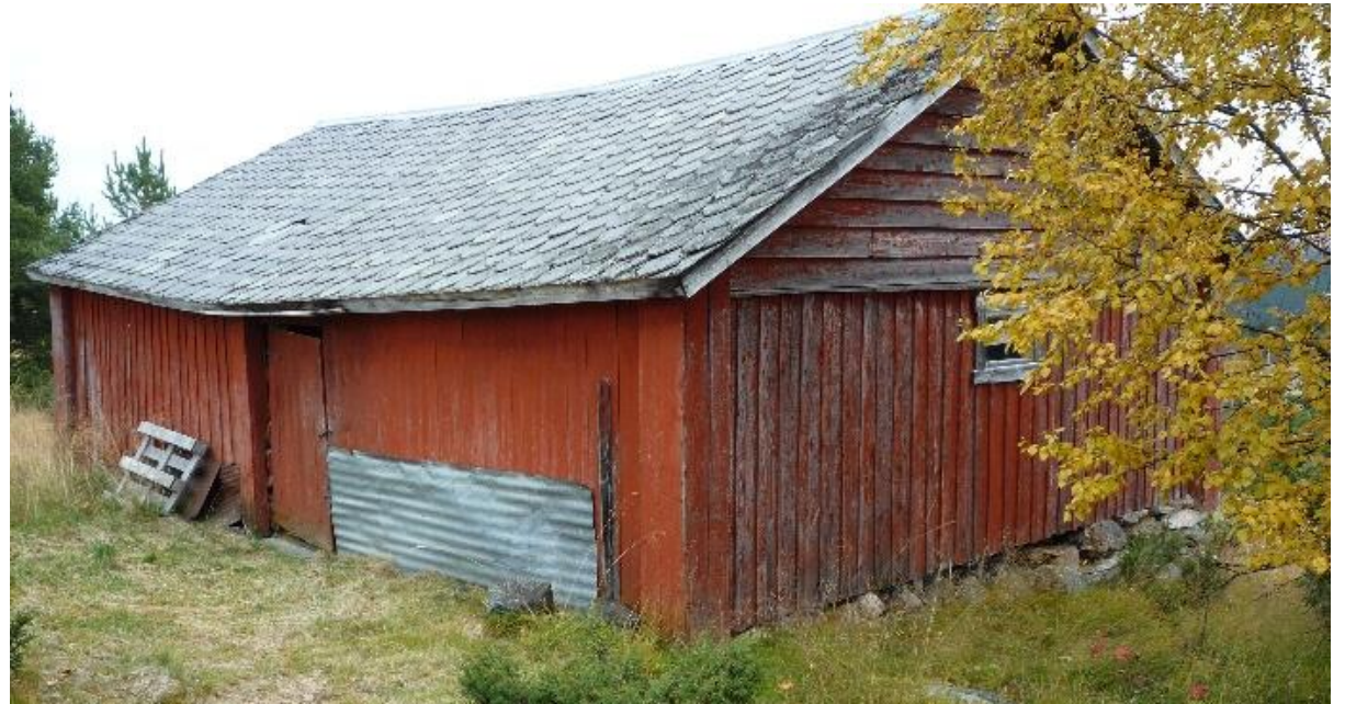
Måla, bordkledte tømmerfjøs