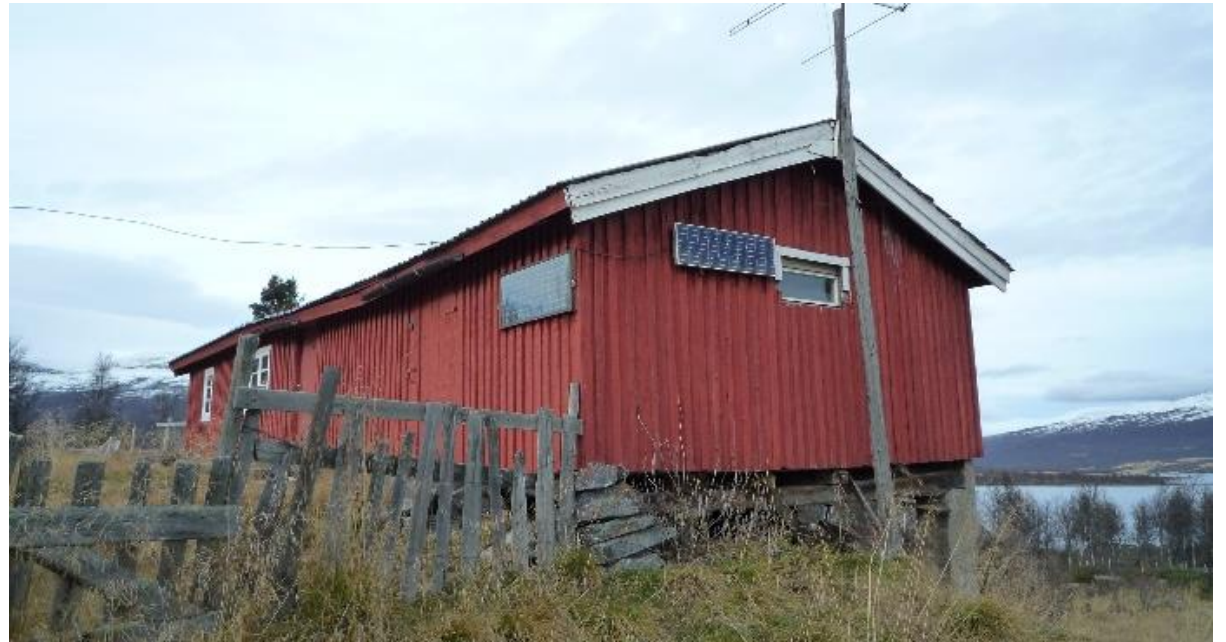
Sel og fjøs i same lengde