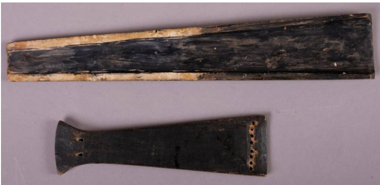
12 Gripebrett og strengeholder fra baksiden