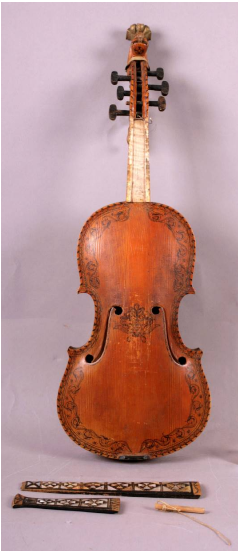
1 Hardingfele før konservering