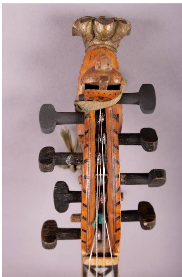
14 To nye stemmeskruer øverst og ny oversal