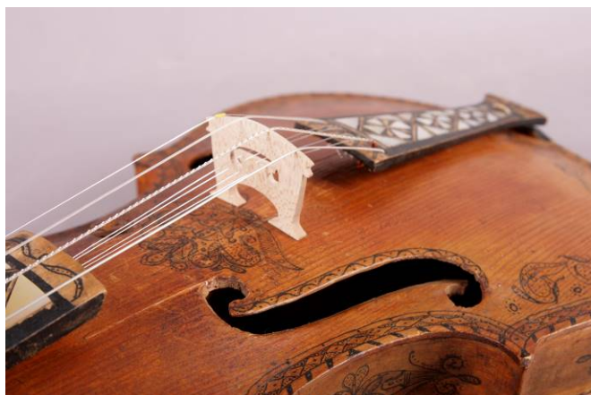
13 Ny stor og nye strenger