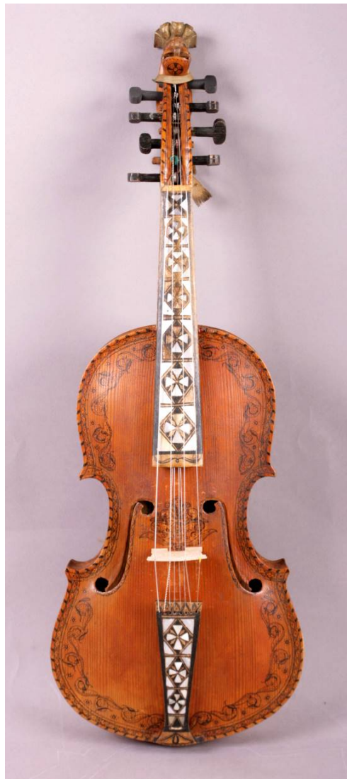
2 Etter konservering