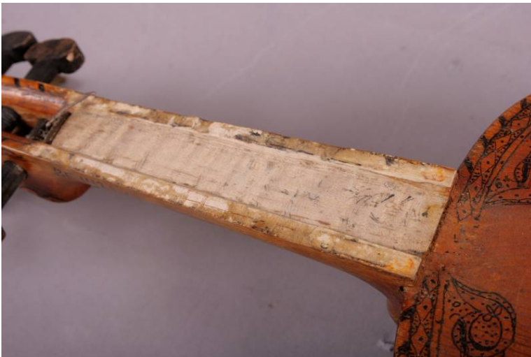
10 Hals uten gripebrett