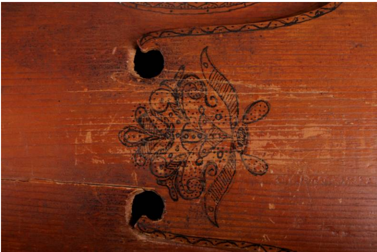
9 Sprekk ved f-hullet