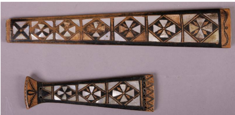
11 Gripebrett og strengeholder