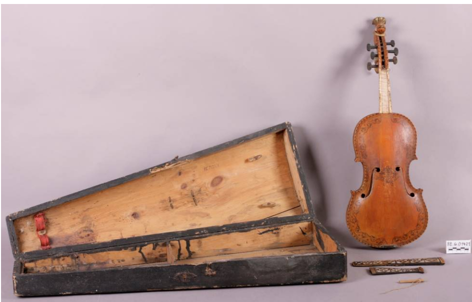
3 Hardingfele med kasse og alle løse delene.

Hardingfela ble transportert til Ringve musikkmuseum for konservering. Den er plassert i en fiolinkasse av svart malt tre. Tre løse deler følger med.