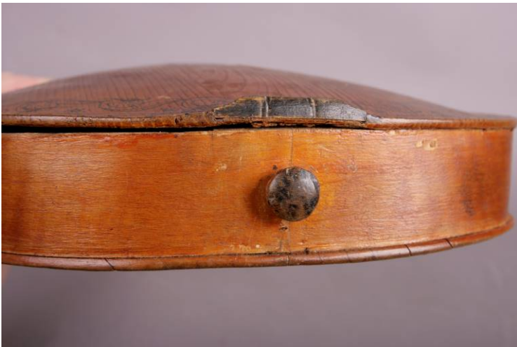
8 Åpen limfuge mellom sarg og lokk