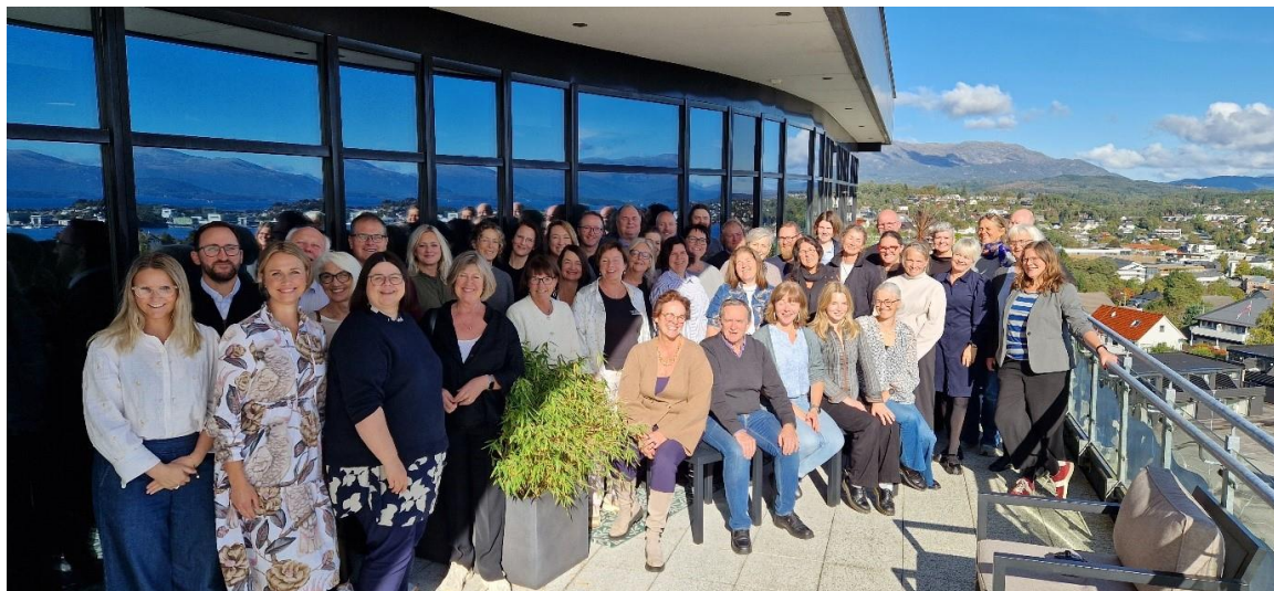
Bilde 5: Nasjonalt nettverksseminar 2024.