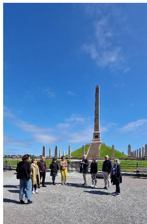
Bilde 1: Nasjonal komité Nasjonaljubileet 2030 foran Haraldshaugen.