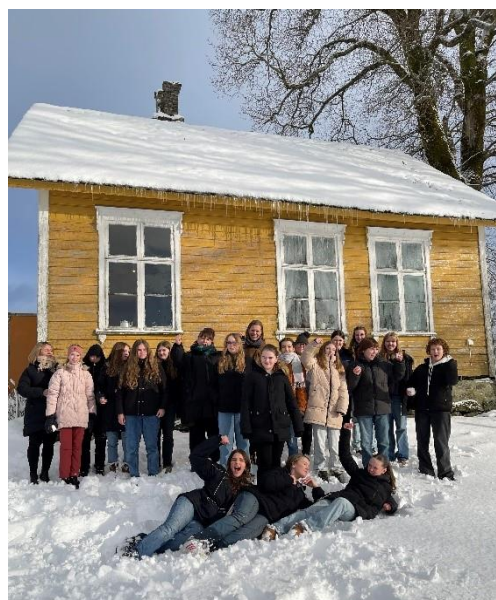
Bilde 4: Ungdommens hærpil - en samtale for nye tusen år, Moster 2024.